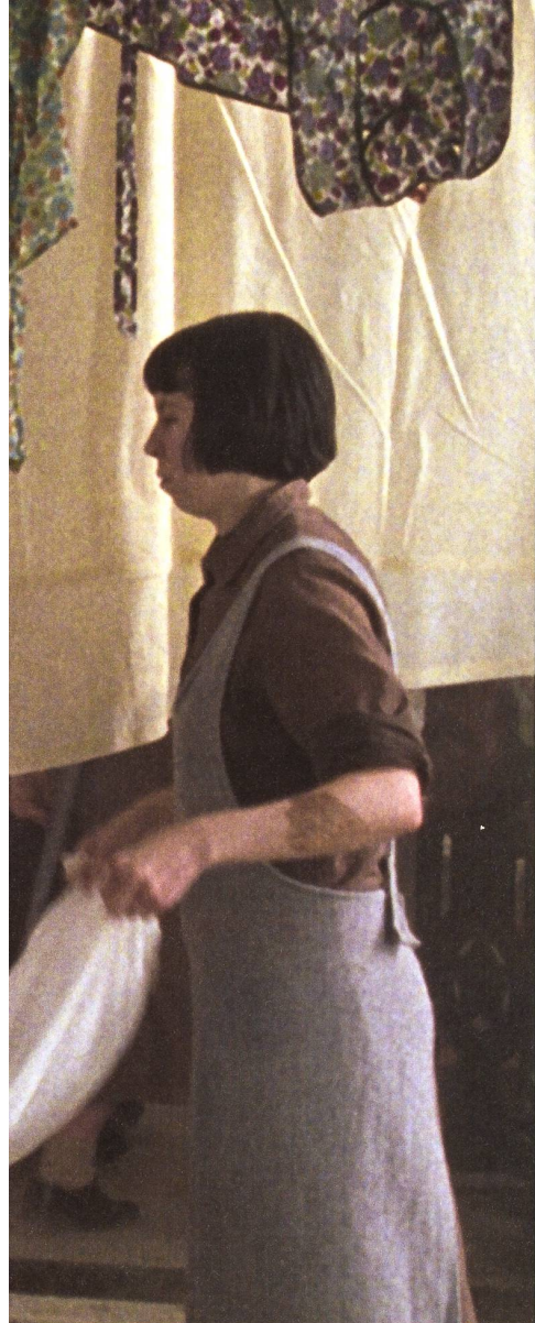
Le couvent des sœurs de Marie-Madeleine, pension de jeunes filles, blanchisserie et prison

Réalisation, scénario Peter Mullan. Image Nigel Willoughby. Musique Craig Armstrong. Son Colin Nicolson. Montage Colin Monie. Décor Mark Leese. Interprétation Geraldine McEwan, Anne-Marie Duff, Nora-Jane Noone, Dorothy Duffy... Production PFP Films, Film Council, Momentum Pictures; Frances Higonson. Distribution Frenetic Films (2002, GB / Irlande). Durée 1 h 59. En salles 5 mars.