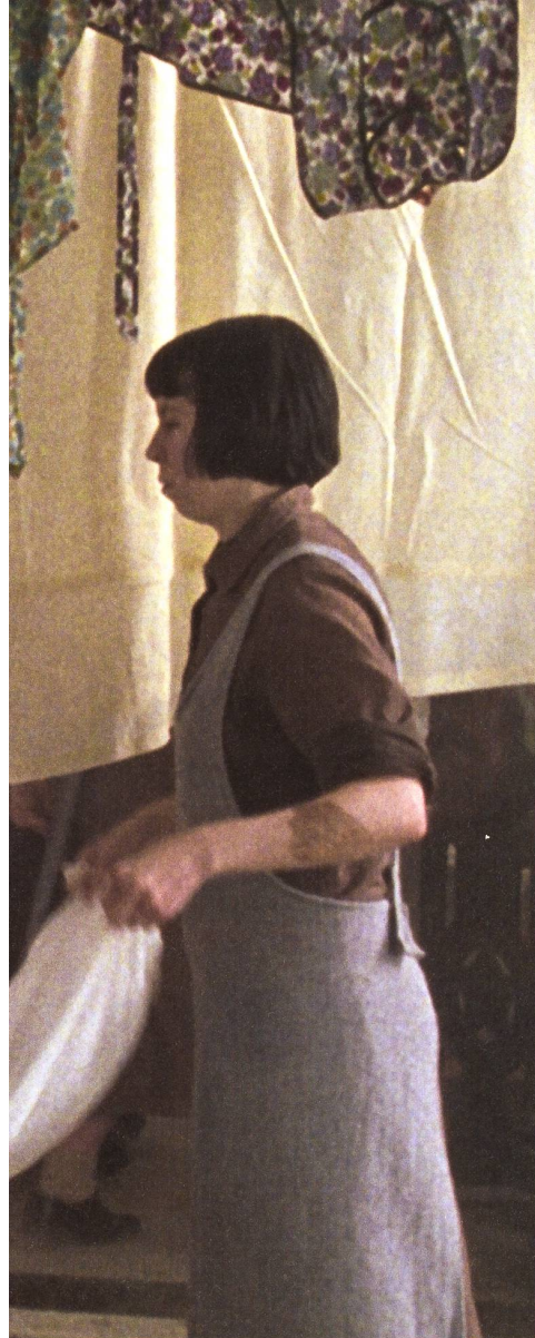
Le couvent des sœurs de Marie-Madeleine, pension de jeunes filles, blanchisserie et prison

Réalisation, scénario Peter Mullan. Image Nigel Willoughby. Musique Craig Armstrong. Son Colin Nicolson. Montage Colin Monie. Décor Mark Leese. Interprétation Geraldine McEwan, Anne-Marie Duff, Nora-Jane Noone, Dorothy Duffy... Production PFP Films, Film Council, Momentum Pictures; Frances Higonson. Distribution Frenetic Films (2002, GB / Irlande). Durée 1 h 59. En salles 5 mars.