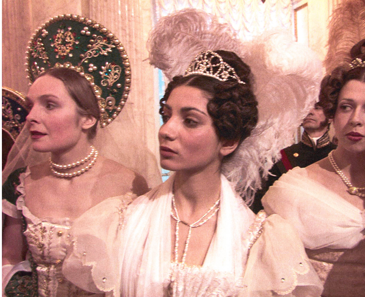
Les danseuses se présentent au bal des officiers...