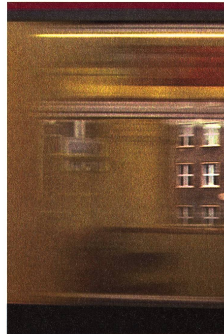
«Vaterland» de Thomas Heise

Une fois encore, le cinéma documentaire que Visions du Réel met en valeur se révèle de plain-pied avec l'actualité, témoignant des inquiétudes et des violences de ce monde, mais aussi spectaculaire, inventif et provocateur quant aux écritures. Une fois encore, des sensibilités nouvelles émergent au contact de telle crise comme en Argentine, mais aussi grâce à l'avènement de la technologie numérique comme en Chine ou en Corée. La caméra peut ainsi filmer quand les feux de l'actualité se sont éteints (au Rwanda, en Tchétchénie ou en Israël), ou devenir ce journal intime auquel on confie ses pensées et ses peurs.