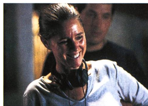
La cinéaste Julie Taymor

Stephen Daldry, Sam Mendes, Rob Marshall et aujourd'hui Julie Taymor: après des années sans transfuges notables, les temps semblent à nouveau favorables au passage de vedettes de la scène à l'écran. Pas plus que ses collègues, Julie Taymor n'est une pure novice, ayant fait ses premières armes à la télévision. Elle est aussi depuis vingt ans la compagne d'un des meilleurs musiciens de film actuels, Elliot Goldenthal («Heat», «Entretien avec un vampire», etc.), ce qui peut expliquer une