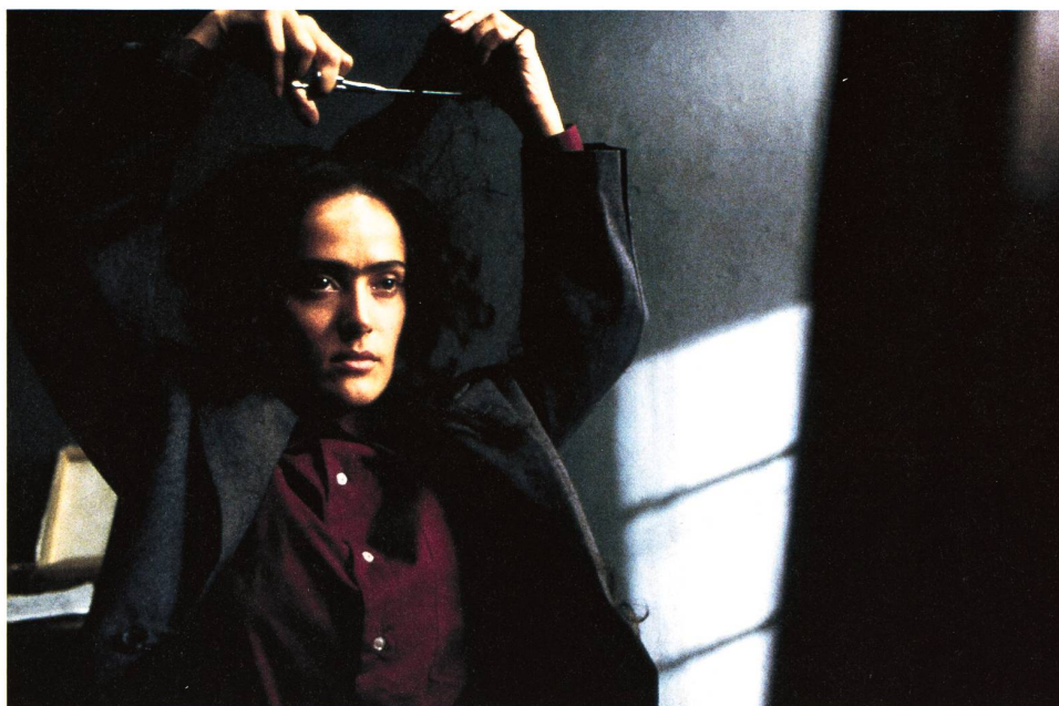
La peintre mexicaine Frida Kahlo (Salma Hayek)

la faute d'un André Breton qui s'est déplacé en 1938 à Mexico pour y découvrir ses peintures, «un ruban autour d'une bombe», se serait exclamé l'auteur du Manifeste! Même si elle admirait particulièrement Magritte, Frida a bel et bien élaboré son