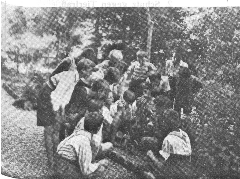
Auf der Suche nach den Pollinien eines Knabenkrautes.