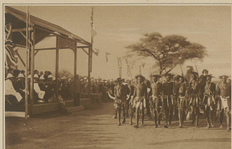
Ada feiert geschnittene Eingeborene von Isoboko, die ihren mit Obstgezeugen vor dem Feiern von Wales