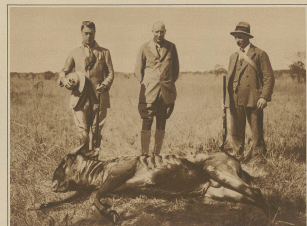
Der englische Königspriest (links im Bild) auf der Jagd in Afrika