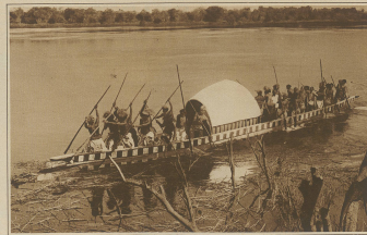
Die Staatsboote des Häuptlings Yeta von Nord-Rhodesien auf dem Zambezi