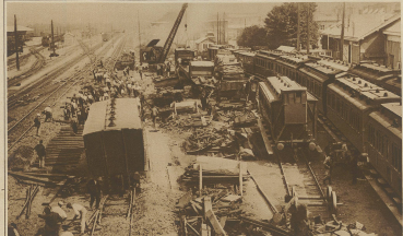
Bild vom großen Eisenbahnzug in Amiens, dem wiederum 12 Menschenleben zum Opfer fielen. Als Ursache wird einseitig die verminderte Fahrgeschwindigkeit angegeben, die 118 km betragen haben soll