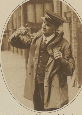
Das englische Oberstleutnant Sir John Dill, der in Zürich im Hotel 'Victoria' eintrifft, wird von den Schweizerischen Behörden empfangen