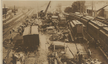
Bild vom großen Eisenbahnbahnhof in Amiens, dem wiederum 12 Menschenleben zum Opfer fielen. Als Ursache wird ein mangelhaftes Fahrgeschwindigkeit angegeben, die 118 km betragen haben soll