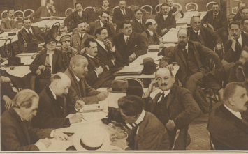
Kongress der französischen Sozialisten in Paris, im Vordergrund die bekanntesten Führer: Roussier, Mayras, Hirsch, Zyrenski und Léon Blum