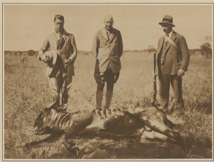
Der englische Konsul (links im Bild) auf der Jagd in Afrika