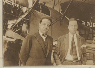
Die beiden französischen Premierminister Aristide Briand und Raymond Poincaré vor dem Aufzug zum großen Fluss