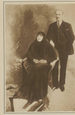
Das amerikanische Schauspiel 'Mitternacht in London' wird in Zürich am 10. und 11. d. M. im Theater am Hof aufgeführt