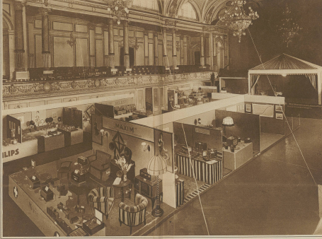
Blick in die Schweizerische Radioanstalt in der Tonhalle in Zürich