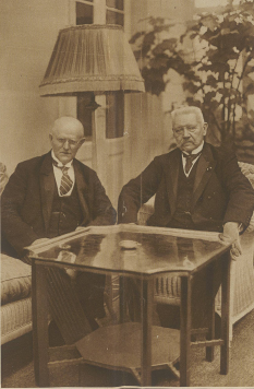
Reich der deutschen Reichstagskammer in München, Reichstagskammer in München, Reichstagskammer in München