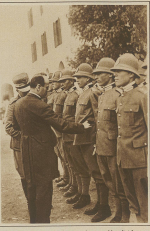
Die Schweizerische Armee wird im nächsten Herbst bei einer Masseneinübung in vier verschiedenen Kantonen