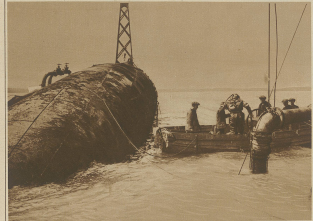
Hebung des während des Krieges versunkenen Schiffes 'Clatten' im Hafen von Dover