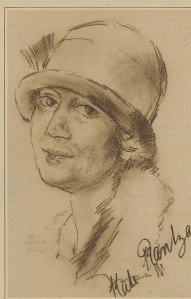
Katerbau, die bekannteste Wiener Bohemienfahrer, klassierte sich mit ihrem Ansaldowagen als Vierte in ihrer Klasse. Originalzeichnung für die Zürcher Illustrierte von Hans Kay