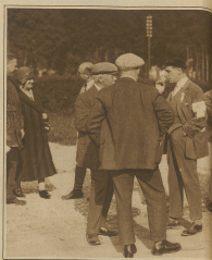
Mitglieder des Organisationskomitees