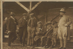
Blick in den Unterstand der Presse