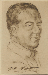
Graf Masetti Originalzeichnung für die Zürcher Illustrierte von Hans Kay