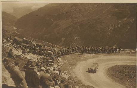
Stevest Hameln, auf seinen 6 Zylinder Selva-Sportwagen in einer Kurve