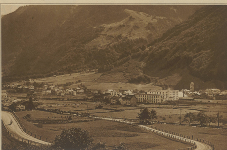
Ansicht von Linthal mit der ersten Schleife der Klausenstrasse