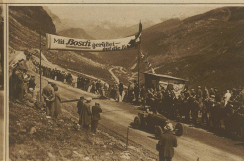
Kosché auf Bagetti im Ziel