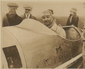
Driver einer der bekanntesten französischen Rennfahrer, siegte in seiner Kategorie in 17 Min. 45/5 Sek.