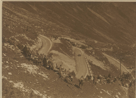
Drei übereinander liegende Kurven oberhalb der Vorfrutt