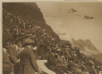
Die dichtgedrängte Zuschauermenge auf einem Felskopf oberhalb der Vorfrutt