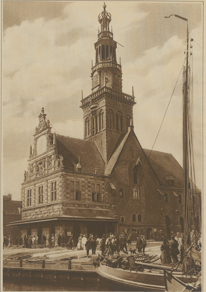
Die amtliche Stadtwage von Alkmaar, die in eine frühere Kirche eingebaut wurde

Von allen Seiten kommen die Bauern, meistens nach langer Fahrt, auf den Markt, stapeln ihren Käse in zwei Lagen übereinander geordnet auf dem Platze auf, bis am Freitag zur behördlich festgesetzten Stunde, das ist 10 Uhr vormittags, die Eröffnung des Marktes erfolgt. Beim Abladen des Käses fliegen die goldgelben Kugeln stets paarweise durch die Luft und es ist bewundernswert, mit welcher Sicherheit die Bauern und Markthelfer dabei jonglieren. Bis zur Eröffnung des Marktes wird der Käse mit Heu, Gras oder Planen zum Schutze gegen Staub und Sonne eingedeckt und um 10 Uhr präsentiert sich das goldgelbe Kugelmeer, in der Sonne reflektierend. Dann erscheinen die Engros-