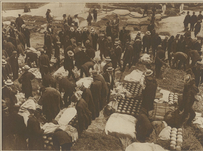
Leben und Treiben auf dem Käsemarkt