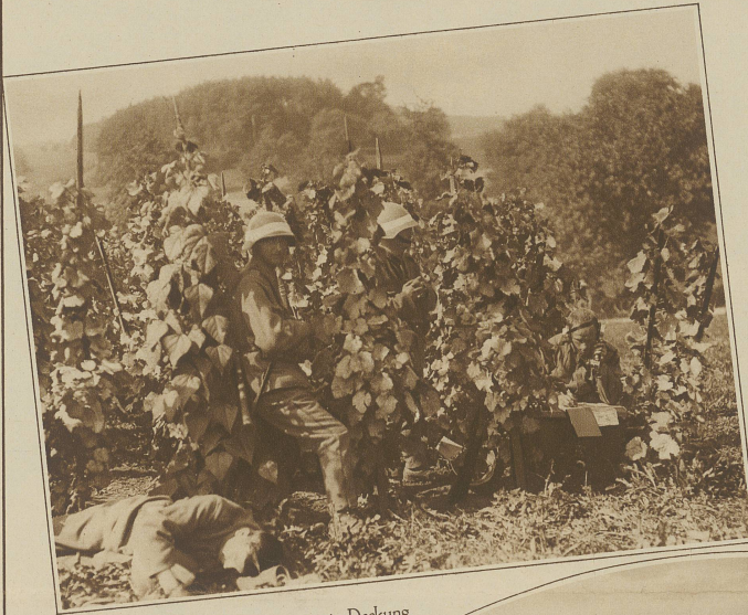
Eine Telephon-Meldestation in Deckung