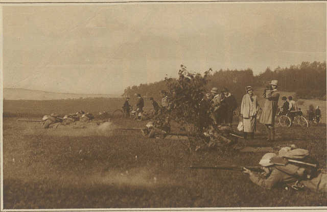
Infanterie im Gefecht