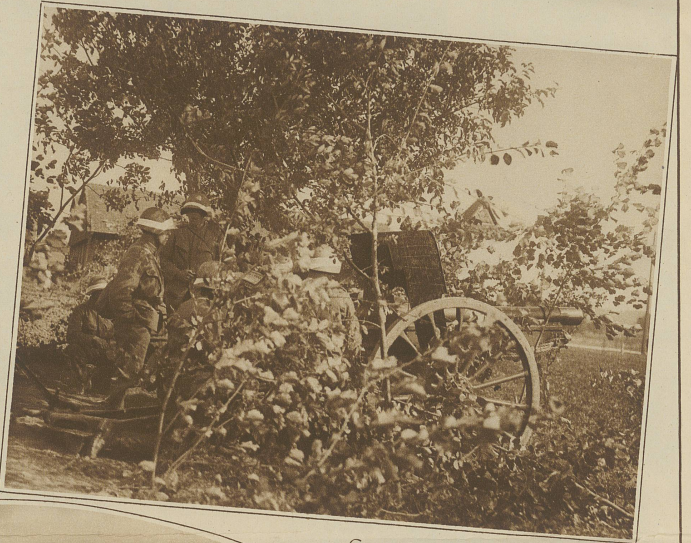
Gut maskiertes Feldgeschütz in Stellung