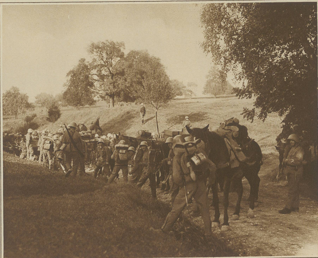
Reserven in Deckung