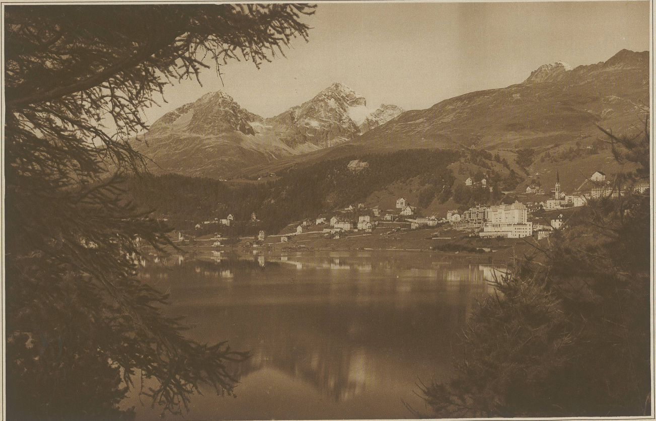
St. Moritz mit Piz Albana und Piz Julier