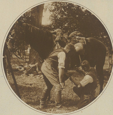
In der Feldschmiede