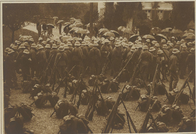
Die Schlacht ist aus . . . .