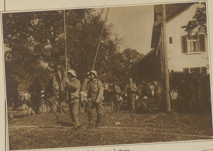
Telephonpatrouille beim Ziehen einer Leitung