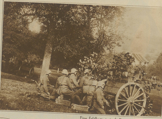
Eine Feldbatterie in Stellung