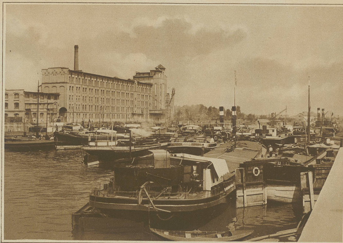
Schweiz. Dampfer und Kähne im Hafen von Straßburg

ähnliche Verhältnisse. Die seit dem Friedensschluß auf dem Rhein erschienenen französischen Reedereien stützen sich, was Beschaffung der nötigen Schiffe und der zu befördernden Ladungen anbetrifft, auf den Staat, der den Reedereien zu billigen Preisen die Schiffe (Reparationschiffe) und auch Transporte zu aus-