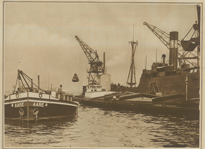
Im Hafen von Rotterdam. Verladen englischer Kohle vom Seedampfer direkt in Schweizerschiffe für den Verband Schweiz. Gaswerke