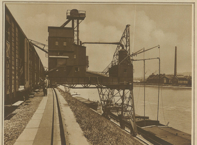
Pneumatischer Getreideheber in Aktion im Hafen von St. Johann, Basel