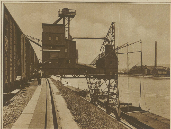
Pneumatischer Getreideheber in Aktion im Hafen von St. Johann, Basel