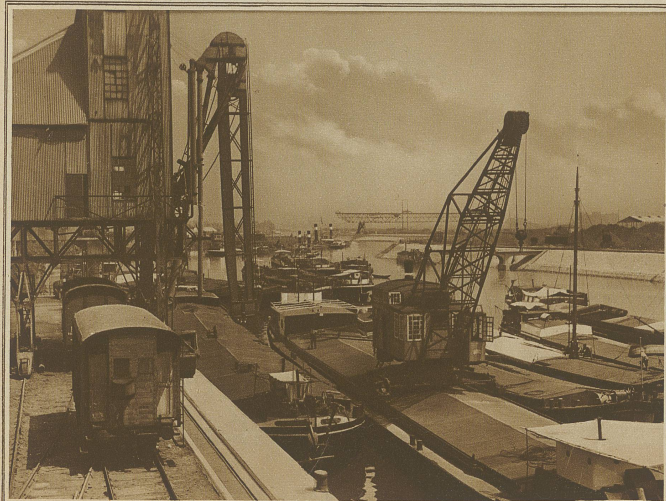
Ein schweizerisches Kransschiff leichtert Kähne für die Weiterfahrt nach Basel. Im Hintergrund zwei Schweizerdampfer