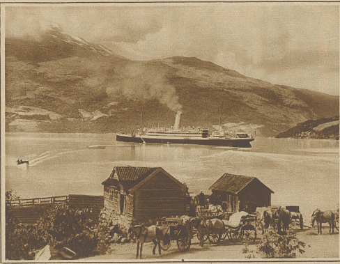
Loen im Nordfjord