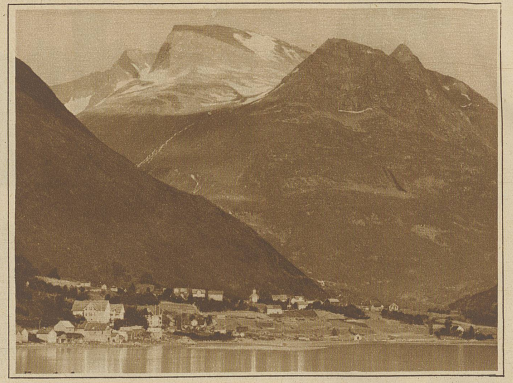
Blick auf Sven, das ebenso gut in der Schweiz wie am Nordfjord liegen könnte

Nun gilt es Abschied zu nehmen von Bergen. Mit der Bergbahn sause ich noch einmal auf die Spitze des Floyen. Blutrot versinkt die Sonne im Fjord. Wie zu frohem Feste geschmückt liegt in der Tiefe die erleuchtete Hansestadt. Von schimmernden Perlensträngen ist ringsum die Bucht umkränzt. Dampf schallen die Signale der aus- und einfahrenden Dampfer zu mir herauf. Hell erleuchtete Motorboote huschen über den Hafen. Wie Glühwürmchen flirren die Autos durch die Straßen. Wie eine feurige Schlange windet sich ein Zug der Bergbahn durch das dunkle Tal. Um die beiden Binnenseen ziehen sich glühende Guirlanden. Das ganze Tal scheint mit Tausenden von Sternchen bestückt. Von den Hügeln am Fjord blitzen die Lichter der Landhäuser. Ich kehre auf den sich in Serpentina herabschlängelndem Wege zu Fuß zurück. Bald umfängt mich wieder das Getümmel der Stadt. In schneller Fahrt führe mich das Auto zum Quai der Fjorddampfer.