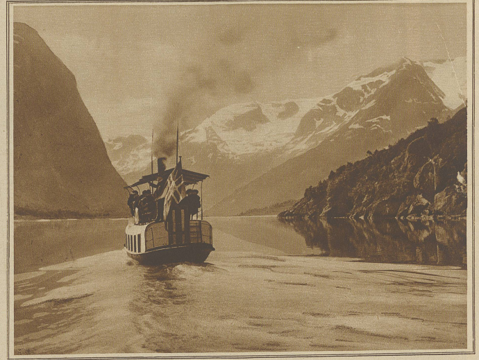
Eine Fahrt auf dem Oldensee