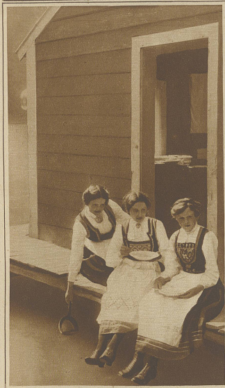
Mädchen aus Loen in ihren malerischen Trachten