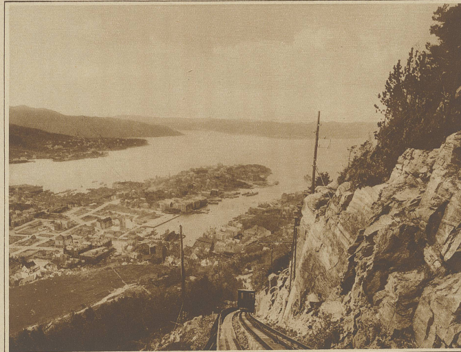
Die Stadt Bergen. Im Vordergrund die Bahn auf den Floyen-Felsen

In Naustadt, Nordfjordeid, Sandane, Utviken, Stryn legen wir an. Ein Ort immer idyllischer gelegen wie der andere. Auf grünen Abhängen die rot-gelben Häuschen, umrahmt von dunklem Wald. Von steilen Felsen grüßen Gebötte und Semnhütten. Dahinter erheben sich weißglitzernde Bergriesen. Inmitten des Friedhofes das alte Kirchlein. Dicht am Ufer pittoreske grasbedeckte Bootshäuschen.