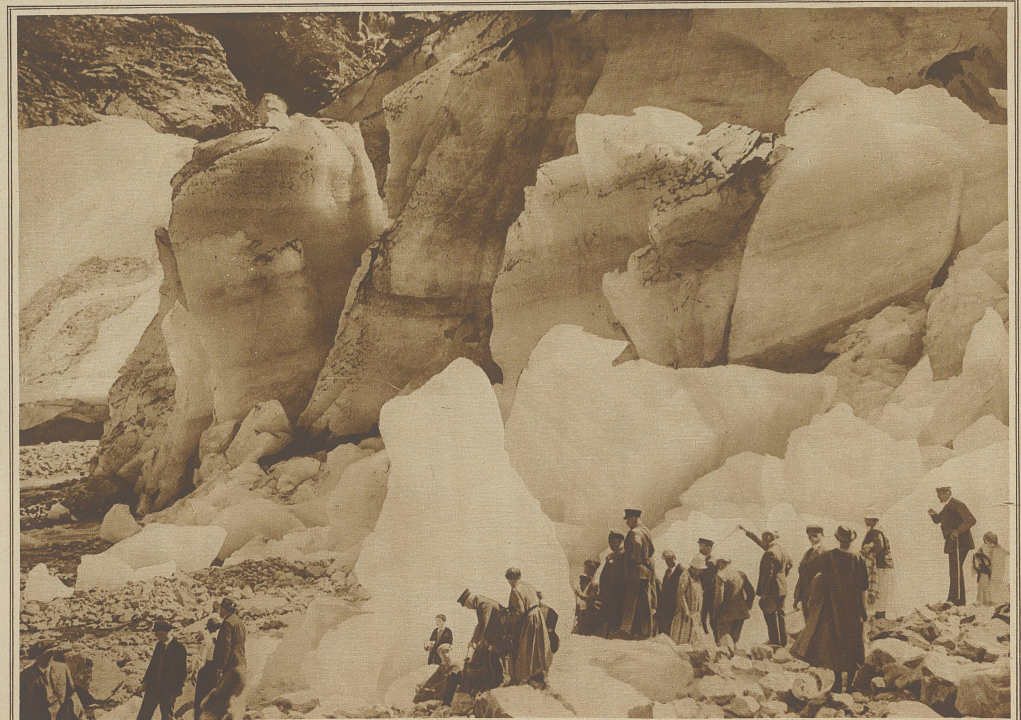
Der Absturz des «Jostedalbrae», des größten europäischen Gletschers

Noch lange saß ich des Abends mit dem freundlichen Wirte plaudernd im Salon, während im Kamin die Scheite knisterten. Alle Einzelheiten der morgigen großen Autofahrt vom Nordfjord zum Sognefjord wurden genau besprochen. In meinem schneeweiden Zimmer wiegt mich das Rauschen des Fjords in tiefen Schlaf.