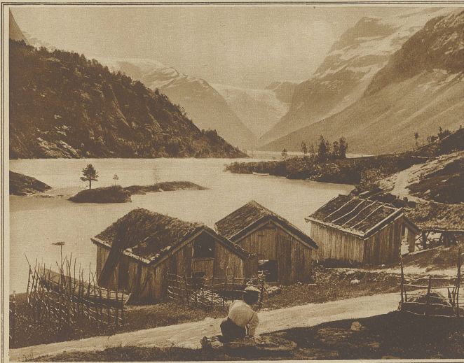
Blick auf den Loensee