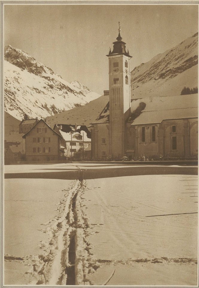
Winter in Andermatt