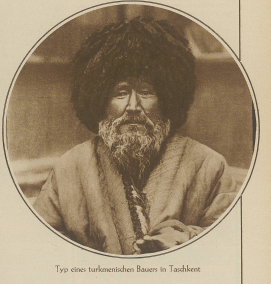
Typ eines türkischen Bauern in Tschikment