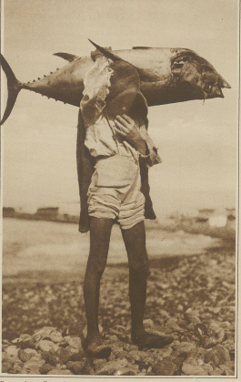
Ein prächtiges Exemplar eines auf den karaischen Inseln gefangenen Theobates