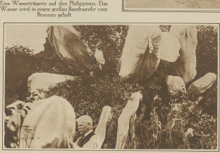
Ein Wassertränke auf den Philippinen. Das Wasser wird in einem großen Bambusrohr vom Brunnen geholt.