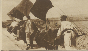
Japan, Japan. Japanische A. B. C. - Schützen auf dem Wege zur Schule. Man beachte die eigenartige Fußbekleidung