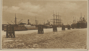
Blick auf den vereisten Segelschiffhafen von Hamburg, dessen Verkehr durch das viele Treibeis betrüblich vollständig behindert wurde.