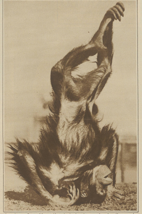
Dem Rassen «Orange-Lige» «Kessig», die Leuchtener prodigiosen Urtiers geht es so sat, daß er von Verposten auf dem Berge steht