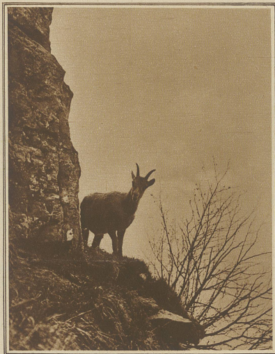
Steinbock im Gebiet der Grauen Hörner im St. Galler Oberland

Wir sind fast alle Jäger. Sonderbar! Ausgeklügelt diese Grünröcke betätigen sich an der Aussetzung von Steinwild, sie, die sich in der Jagdzeit mit Büchse und Flinte in den Bergen herumtreiben, um das flüchtige Gratier, den flinken Schnehasen oder den heimlichen Spielhahn zu erlegen. Heißt das nicht in Paradoxien machen und die vernünftige Weltordnung auf den Kopf stellen! Halt, — der weidgerechte Jäger, er dem es nie und nimmer ums Ausrot-