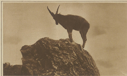
Steinbock im Hochgebirge

Es war ein unvergeßlicher Augenblick, als