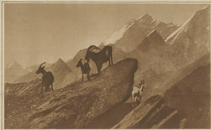
Bastarde. Eine Kreuzung zwischen Steinbock und Ziege

Wildreichtum zeugten. Tannenhäher rätschten. Wacholderdrosseln und Bergfinken, Erlenzsige und Goldhähnchen waren zugegen. Weiter oben fand ich Wölfe von einem Schneehasen. Eine Birkenhenne strich vor mir ab. Und als wir oben auf dem Plateau anlangten und behutsam unsere