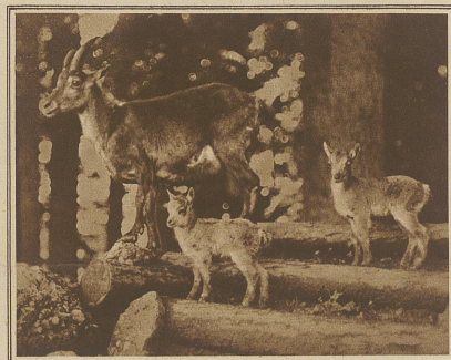
Steinbockgeiß mit jungen Zwillingen

Köpfe in die Höhe schoben, entdeckten wir bald ein starkes Rudel Gamsen, bei dem ich mindestens dreißig bis vierzig Stück zählte. Es waren fast alles Muttertiere mit kleinen, aber äußerst munteren Kitzen, deren Alter ich auf etwa drei Wochen schätzte. Schließlich waren wir von allen Seiten von flüchtigem oder herumziehendem Krickelwilde umgeben. Da hörten wir einen warnenden Pfiff, dort steinelte ein Bock vorbei, es