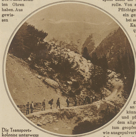
Die Transportkolonne unterwegs

Am 20. Juni traf ich in dem romantischen Bündner Dörflein Bergün mit einer kleinen Gesellschaft zusammen. Wir hatten etwas ganz Wichtiges vor. Darum saßen wir so ernst und feierlich beisammen. Es wurde fast nur im Flüsterton gesprochen. Die Wände konnten Ohren haben. Aus gewissen