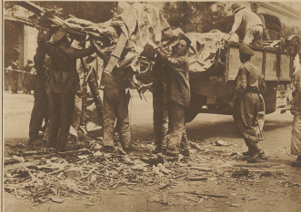
Letzte Woche stürzte ein Fregatensender in die Stadt Mailand ab, abwärtsgerissen ohne auf der belebten Straße vorbeigehende Passanten zu treffen. Das Aufräumen der Trümmer