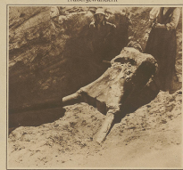
Die Hüfte von Phidias wurde bei Entdeckung von Truhen in einem Grab gefunden. Die Hüfte ist ein Werk des Phidias, der die Statue des Mars in Athen schuf. Die Hüfte ist ein Werk des Phidias, der die Statue des Mars in Athen schuf.