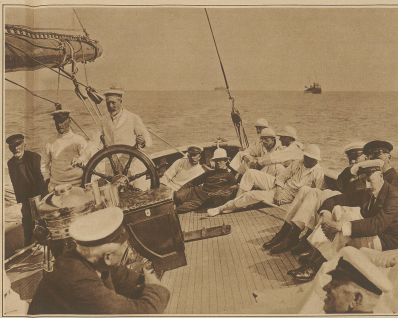
König Georg von England als Steuermann auf seiner Yacht Britannia während einer großen Regatta in Cowes