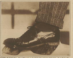
Die Füße der Vorderman. Dieser 1902 wird an die Schulferien bekannter Persönlichkeiten, die im Jahre die Füße mit von England waren, haben von 1902 bis zum Jahre 1910 in der Vorderman Halle, London, ausgestellt