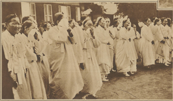
Eine pompöse Beerdigung in Kona, Fidjilanden in Trauergekleidern