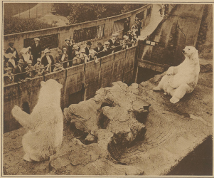
Bettelnde Eisbären im Londoner Zoo