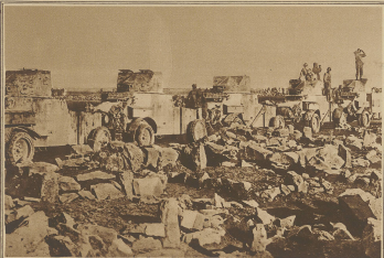
Zu den Kämpfen in Syrien. Französische Panzerautos in Gefechtsstellung