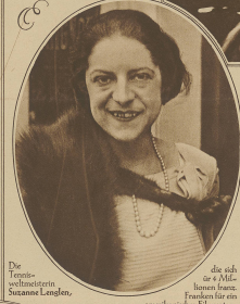
Die Tennisspielerin Suzanne Lenglen