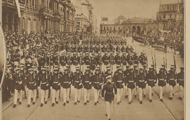
Argentinische Nationalfeier. Der Paradezug der Kadetten