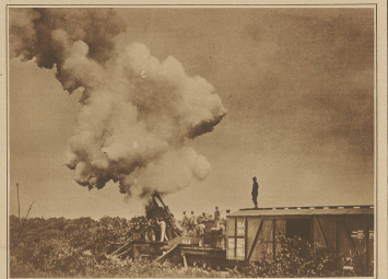
Amerikanische Freiwillige bei einer Schießübung mit einem schweren Eisenbahngeschütz