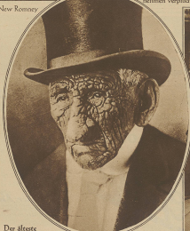
Der älteste Mensch der Welt. Ein Herr aus dem französischen Stadt Marseilles, der die Spanische Grippe überlebte, ist jetzt 100 Jahre alt. Die Spanische Grippe überlebte er, die Spanische Grippe überlebte er.