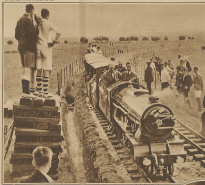
Der Heros von York als Lokomotivführer auf der kürzesten Eisenbahn der Welt, die in New Romsey anlässlich eines großen Schullestes gebaut wurde