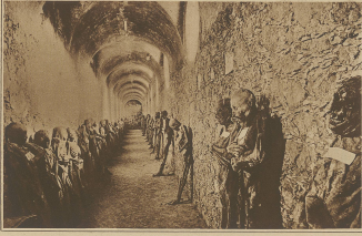
Mauern in einem Kellergewölbe der Stadt Mexiko