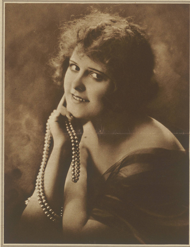
Die Filmschauspielerin Liane Haid

«Das ist doch komisch,» sagte der dritte Steuermann, «als ich die Wache antrat, kam er von Westen, und nun ist er den halben Kompaß rumgegangen. Nicht schnell oder ruckweise, sondern langsam und sicher, immer nur einen Strich nach dem andern, von Westen nach Osten. Das ist nicht übel.»