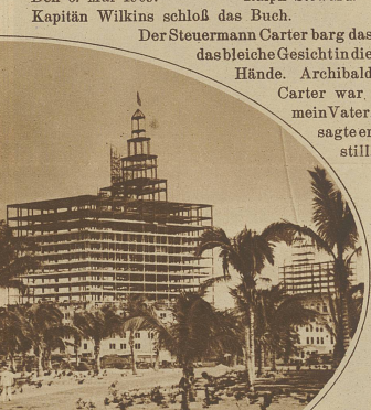
Gesamtansicht der Stadt Miami, die durch den Orkan vollständig in Trümmer gelegt wurde