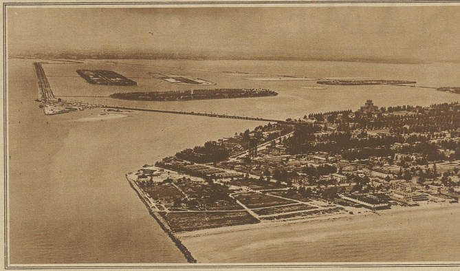
Blick auf einige der Küste vorgelagerte Inseln mit den Verbindungsbrücken, die alle durch die vom Orkan gepeitschte Sturmflut zerstört wurden

Der Gürtel enthielt hundertsechzehn Goldstücke und mehr als sechstausend Dollar in Scheinen. In dem Revolver befanden sich drei Patronen.