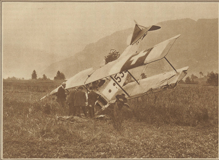
Amliche Untersuchung auf der Unglücksstelle. Vor dem Apparat liegen noch die mit Tüchern verdeckten Leichen der beiden vom Propeller getöteten Knaben