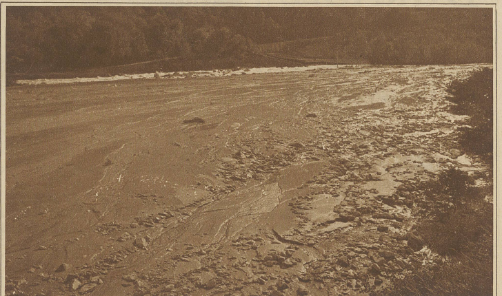
Die schmutzigen Schlammassen im früheren Flußbett