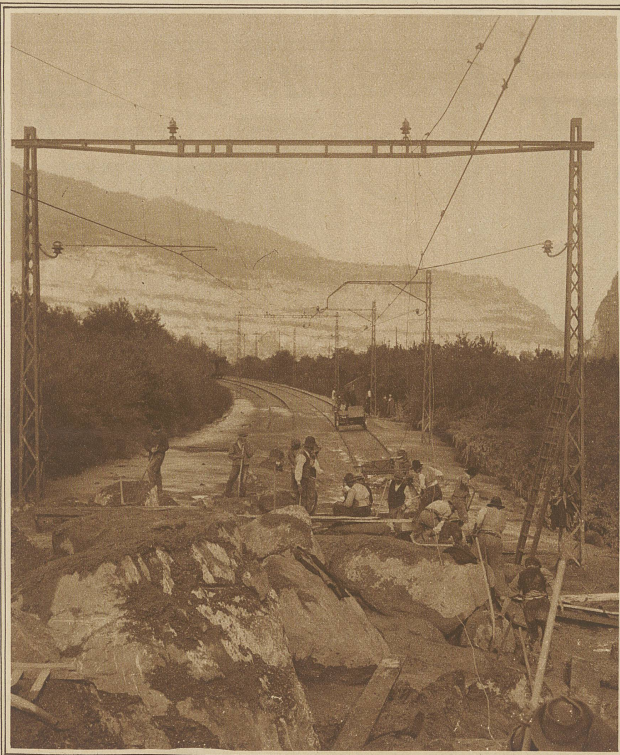
Räumungsarbeiten auf der mit großen Felsblöcken übersäten Simplonlinie der Schweizerischen Bundesbahnen

Den in unserer letzten Nummer gezeigten ersten Hochfluten des Barthélemy-Wildbaches sind, hervorgerufen durch die Regenfälle anfangs dieser Woche, weitere gefolgt. Die unaufhaltsam vordringenden Schutt- und Schlammassen haben die Eisenbahnbrücke der Simplonlinie weggerissen, so daß der internationale Verkehr Italien-Frankreich über den Lötschberg geleitet werden mußte. Die elektrische Lokomotive eines Personenzuges wurde von den Elementen überrascht und konnte erst nach drei Tagen wieder befreit werden. Die auf dem waadtländischen Ufer immer weiterressenden Fluten der Rhone haben das Maschinengebäude der Thermalquelle von Lavey weggerissen. Die mit einem Militärflugzeug angestellten Beobachtungen ergaben, daß sich beim Plan Nevé-Gletscher eine Spalte gebildet hat, aus der sich neue Schlamm- u. Felsenmassen zu Tale ergießen könnten. Der bis jetzt entstandene Schaden wird auf 1,5 Millionen Franken geschätzt