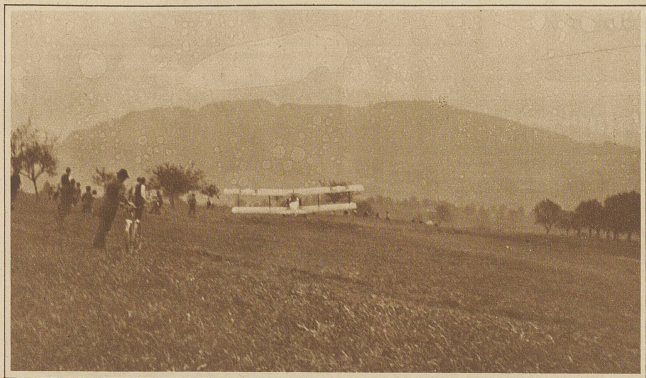
Der Start, kaum 5 Sekunden vor dem Unglück. Man sieht, wie der Apparat mit dem rechten Flügel gegen das Bäumchen fliegt