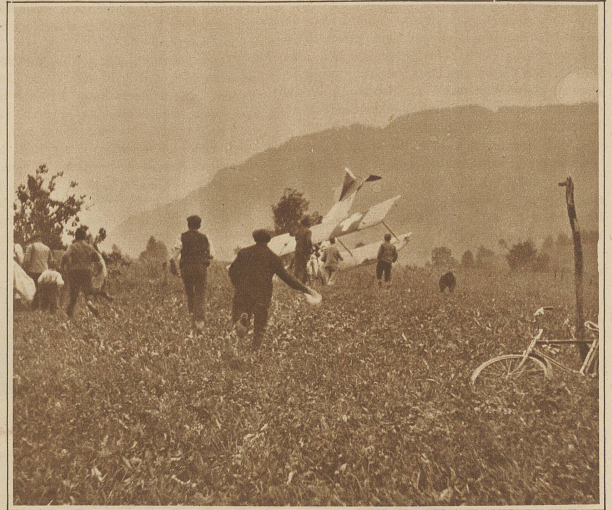
Einige Sekunden nach dem Unglück. Vorn rechts der nackte Stamm des ersten angefahrenen Bäumchens, links dessen Krone, wo auch die Leiche des ersten Knaben liegt