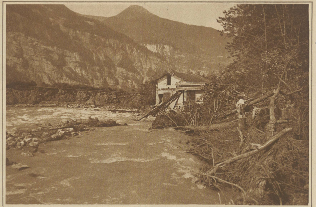
Die letzten Überreste des Maschinenhauses der Thermalquelle Lavey. Links in der Mitte des Bildes ist ersichtlich, wie tief sich der Fluß sein neues Bett eingegraben hat