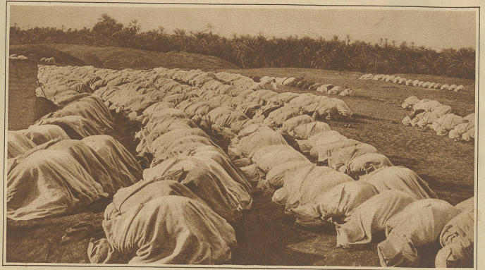
Betende Mohammedaner am Wüstenrand

der Schweizerkonsul Mr Bourgeaud die Expedition am Pier ab. Unter seinem Einfluß öffnen sich die Türen zu vielen Orten, die der Fremde sonst nicht zu sehen bekommt. Verborgene Palastgemächer mit ihrer verschwenderischen Ausstattung und das gepflegte Innere arabischer Bürgerhäuser können gefilmt werden. - In der Araberschule hocken Lehrer und Schüler auf verschränkten Beinen am Boden und lehren ihre Koransprüche her. Dann geht es mit dem Auto ins Innere des Landes zur Affenschlucht, wo die Affen noch heute frei und wild in den Bergwäldern leben. - Im Hinterland von Algier werden interessante und äußerst fremdartig anmutende Bilder von halbwildem, teilweise noch nomadisierenden Arabern festgehalten. Das Lager der Nomaden - unmittelbar neben der Straße angelegt - besteht aus zerlumpte, kleinen Zelten. Männer sind glücklicherweise nicht anwesend, sonst würden es die