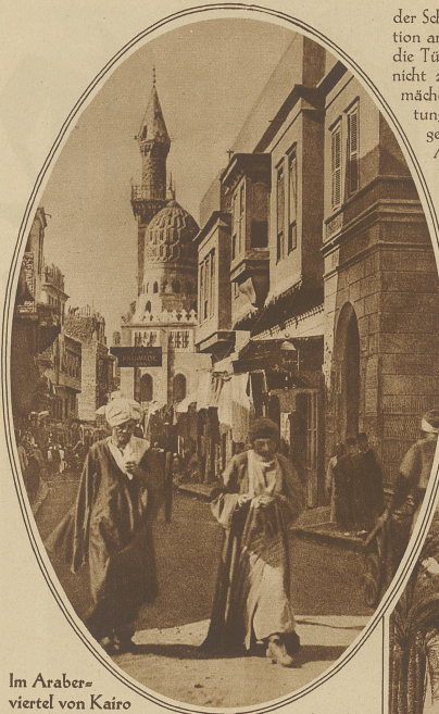
Im Araberviertel von Kairo