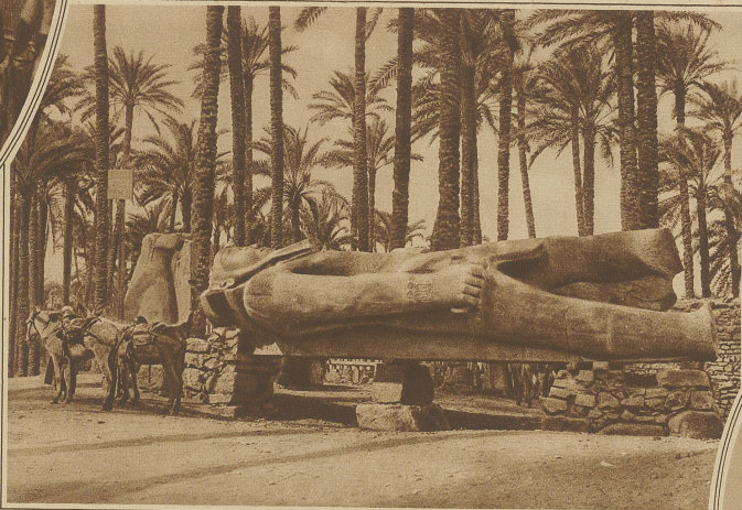
Die Kolossalstatue Ramses II. im Palmenhain von Memphis

ausgeliefert. Dafür bietet sich Gelegenheit, viele lebensvolle Szenen im Kurbelkasten zu konservieren. In Tunis strömen alle Völker und Völkertypen aus Nordafrika zusammen: Beduinen der Wüste, kräftige Kabylen aus dem Atlasgebiet, sowie reine Neger und solche, die infolge Mischung mit andern Rassen die verschiedensten Schattierungen aufweisen. Selten trifft man die europäische Kopfbedeckung; fast ausnahmslos wird Fes oder Burnus getragen und die Frauen sind dicht verschleiert. Ihre schwarzen Gesichtsschleier bilden einen sonderbaren Kontrast zu den blendend weißen Kopftüchern und Ueberwürfen.