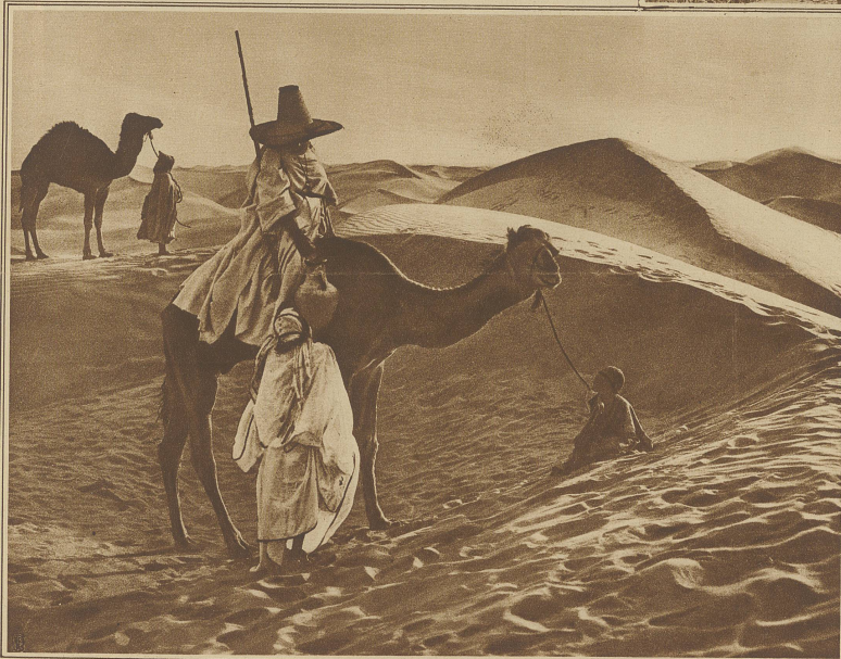
Im Wüstensand bei Biskra