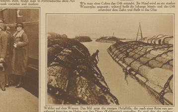
Wörter auf dem Wasser. Das Bild zeigt die ersten Hilfsmittel, die nach einer Katastrophe von einem Boot in den Hafen von San Diego (Kalifornien) überliefen. Es sind dies die größten Fragmente ihrer Art.