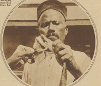
Wie man einer Coban das Gift entzieht. Die Mund wird an ein starkes Wasserrohr angelegt, welches durch die Sprache leitet und das Gift entfernt dem Zahn und Hild in das Glas.