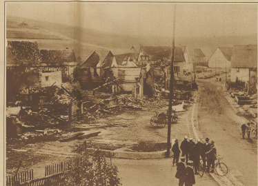
Die Ruinen der 12 Häuser der an der Schweizergrenze gelegenen deutschen Dorfchene Riedschingen, die letzte Woche einem Erdbeben zum Opfer fielen.