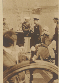
Von der Zusammenkunft Chamberlains mit Mussolini in Livorno. Die beiden Außenminister im Gespräch auf einer Yacht.