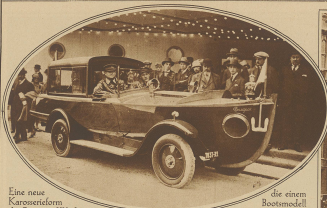
Eine neue Karosseriefabrik der 'Lugnet'-Werke.