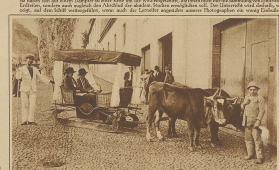
Trotzdem die Welt im Zeichen des Automobils steht, finden wir in Mittelamerika diese Art der Beförderung noch vorfinden und finden.