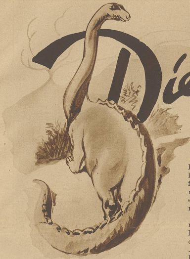
Neu ein tretende Abonnenten erhalten den bereits erschienenen Teil des Romans auf Wunsch gratis nachgeliefert.