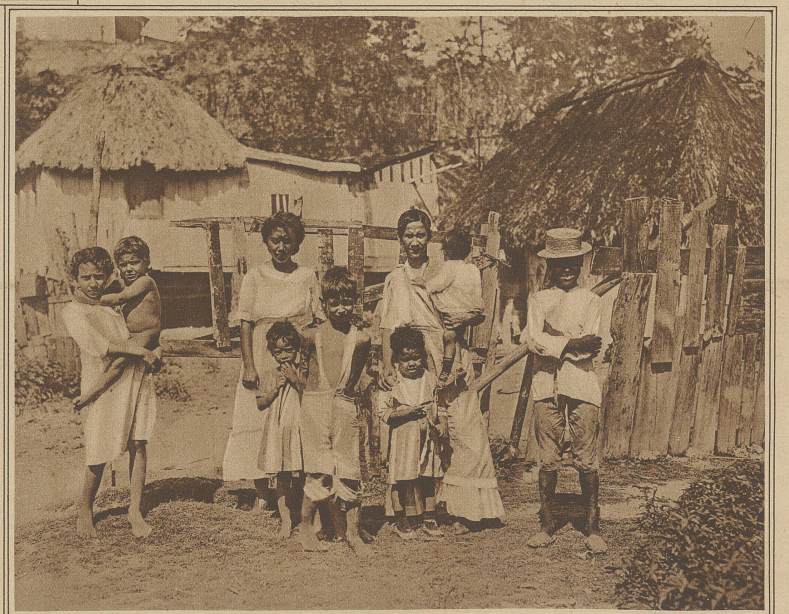
Eine Eingeborenenfamilie vor ihrer Hütte

ihnen die dicke Leibbinde umgebunden. Und nun kommt etwas recht Merkwürdiges. In jedem der verschiedenen Arbeitssäle sitzt auf einem hohen Balkon ein sogenannter Obmann. Er liest den Arbeitern entweder aus der neuesten Zeitung oder einem Magazin etc. solche Artikel vor, die für die braunen Zigarrenraucher von Interesse sind. Das dauert eine Viertel, eine halbe Stunde und vielleicht noch länger; je nachdem. Während dieser Zeit sind alle Zuhörer mäuschenstill. Es wird nicht nur nicht