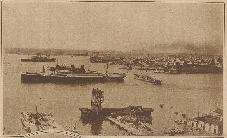
Blick auf den Hafen von Havana

Das alte Havanna liegt drunten am Hafen, der noch vor 10 Jahren ein kleiner Fluß war und nur kleinere Schiffe aufnehmen konnte. Die Havanesen haben aber tapfer sowohl an der Erweiterung des wichtigen Hafens, wie auch an der ihrer schönen Hauptstadt gearbeitet. Von der Mitte der Stadt führt ein entzückender Prado (Park) direkt bis dicht an das Meeresufer. Dieser Prado ist mit wundervollen großen Brunnen, Denkmälern, Boskettis und Blumenvasen mit Blumen reich geschmückt. Abends nach einem heißen Tage auf