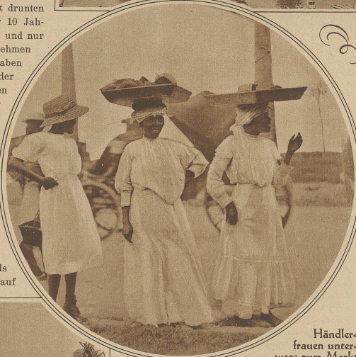
Händlerfrauen unterwegs zum Markt

So ungefähr sah Havanna vor der furchterlichen Sturmkatastrophe aus, die vorige Woche das fruchtbare Inselreich heimsuchte. 650 Menschen fielen dem Wirbelsturm zum Opfer. Weitere 3000 Personen wurden verwundet, darunter 500 schwer. Hunderte von Fischerboten wurden auf die Küste geschleudert, wo sie zerschellten. Infolge der Zerstörungen der Häuser von Havanna sind 3200 Familien obdachlos geworden. Der größte Teil der Stadt steht unter Wasser. Die meisten der im Zerstörungsgebiet gelegenen Zuckerplantagen sind vernichtet. Der gesamte Schaden dürfte annähernd eine Milliarde Franken erreichen.