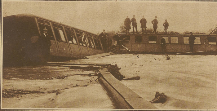
Die großen Ueberschwemmungen im Tirol haben auch die Eisenbahnlinie Bozen-Meran unterspült, so daß der Meraner Frühzug in der Dunkelheit abstürzte. Der strengen Zensur wegen waren bis zur Stunde keine genauen Angaben über die offenbar erhebliche Zahl der Opfer erhältlich. Nach einer Meldung aus Innsbruck sollen 20 Personen ertrunken sein