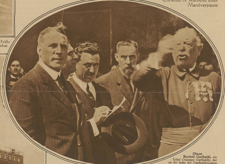
Oberst Ricciotti Garibaldi, ein Enkel Giuseppe Garibaldis, der an der Spitze der Garibaldi-Legion stand, wurde als Faschistenspieler entlarvt. Er genoss als Antifaschist und Führer der Republikaner in Frankreich großes Ansehen, stand aber gleichzeitig im Dienste Mussolinis und bezog das Garibaldi auch beim katalonischen Putschversuch die Hände im Spiel hatte. Unser Bild zeigt Ricciotti Garibaldi (links im Bilde) während der Ansprache eines alten Garibaldianers