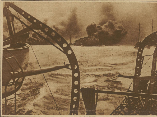
Aus den amerikanischen Flottenmanövern im Stillen Ozean. Die Flotte nebelt sich ein