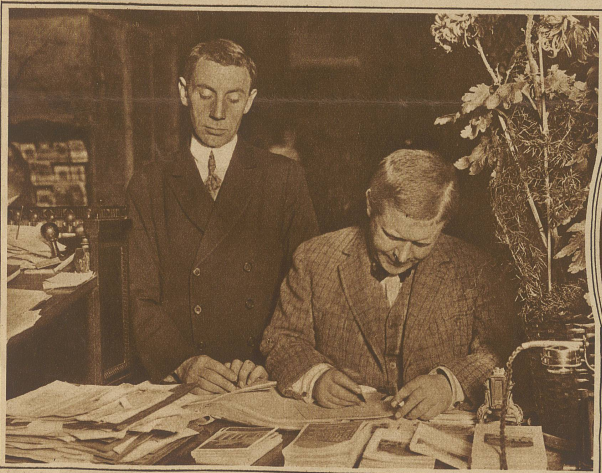
Pat und Patachon «in Zivil» tragen sich auf einer Vergnügungsreise als Hotelgäste ein