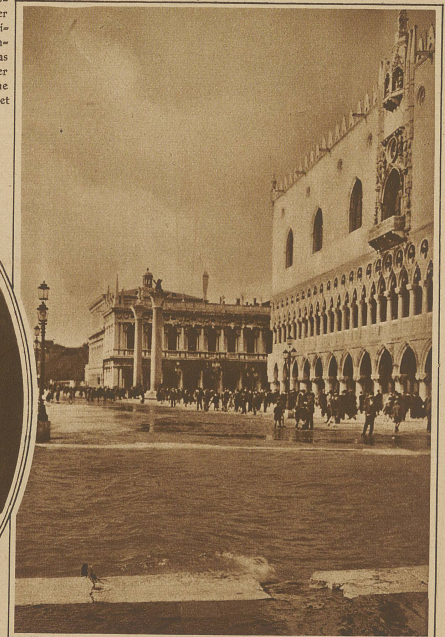
Auch Venedig hat unter dem Hochwasser der letzten Woche schwer gelitten. Unser Bild zeigt die seltene Aufnahme des überschwemmten Markusplatzes, der stellenweise nur auf Stegen passiert werden konnte