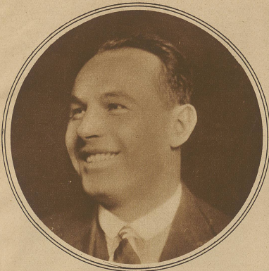
Jan Kiepura, dessen sensationelle Gastspiele an der Wiener und Berliner Oper ihm den schmeichelhaften Titel des Nachfolgers von Caruso eingetragen haben. Kiepura ist polnischer Student