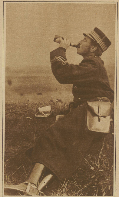
In einem demokratischen Königreich. Der dänische König Christian X. während einer Manöverpause