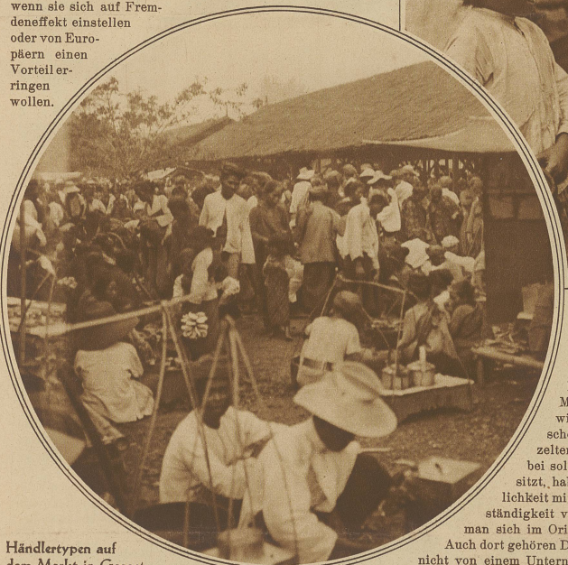
Händlertypen auf dem Markt in Garoet