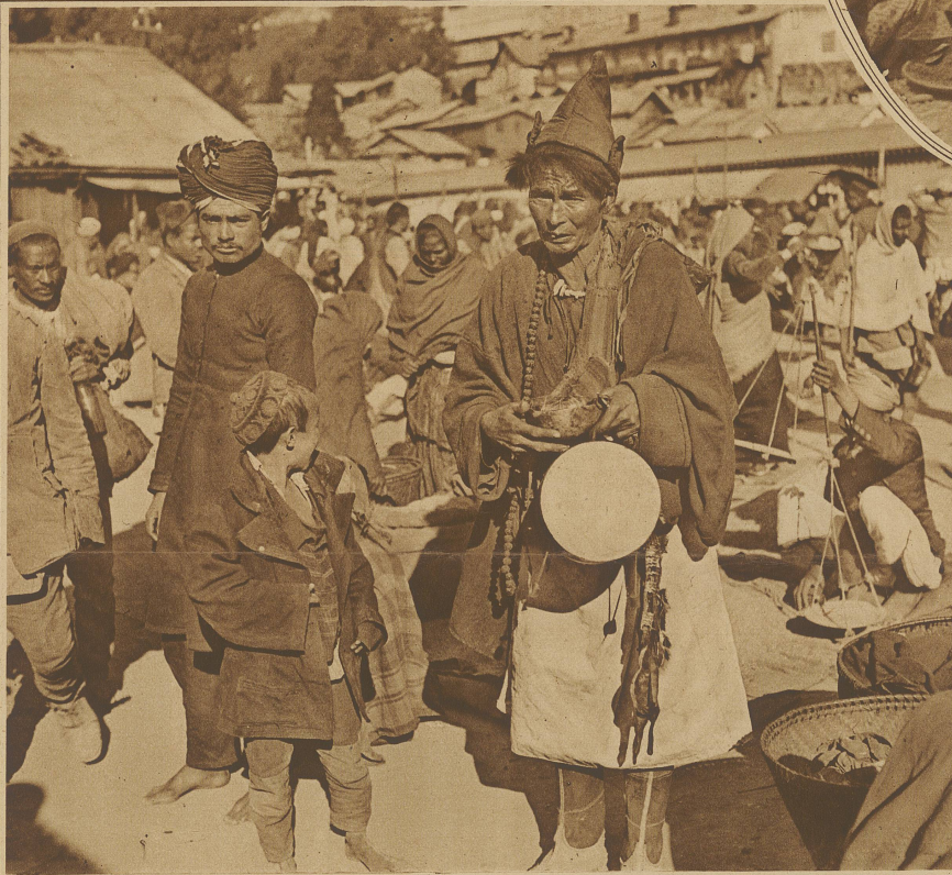
Buthiabettler in Dardjeeling, der die Konjunkturzeit des Basars auszunützen weiß

Es ist unendlich bedauerlich, daß die photographische Technik noch nicht so weit gedieh, Platten auf den Markt zu bringen, die solchen vom Himmelslicht verklär-ten, orientalischen Farbensinn-reichtum und Geschmack aufneh-men und in Kopien wiedergeben können. Worte, seien sie auch von tiefster Begeisterung getragen und von lebendigster Phantasie auf-genommen, werden es doch nie ver-mögen, von dem derart Geschauten auch nur einen annähernden Be-griff zu geben.