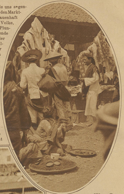
Wertvolle Seidenstoffe und minderwertiger Plunder werden in schönster Harmonie nebeneinander aufgestapelt

gebung, in welche man dabei gerät. / Alle uns s-egenhaft bekannten Volkstypen lernt man unter den Markt-besuchern kennen: Fakire in ihrem grauenhaft ver-wahrlosten Aeußern, Bettler aus dem Volke, behangen mit allem möglichen Flitter und Plunder, in ihrer Erscheinung ehrfurchtgebietende Bettelmönche, den berühmten Gabennapf, der stets so rasch wieder von frommer Bevöl-kerung gefüllt ist, in Händen. / Unter freiem Himmel kauern in melerischem Durcheinander auf der Erde die Klein-händler, die ihr ganzes Verkaufsgut in Körben und Tüchern täglich anschle-pfen und als unzählige, lebende Murillo-bilder ein künstlerisch eingestelltes Auge stets aufs neue begeistern. / Es kann sich nicht satt sehen an der stil-vollen Musterung der Gewänder, sei es nun der gebatikte Sarong und das Kopf-tuch der Javaner, der aus wundervoll fallender, glänzender Seide verfertigte Potzo und Lungl der Birmanen mit dem in lichte Stoffe sonnenwirkungs-gleich eingewebten Goldschimmer oder das reiche Falten-gewand der Inderin, der weiche Spitzenschleier der Parsin. / Man staunt