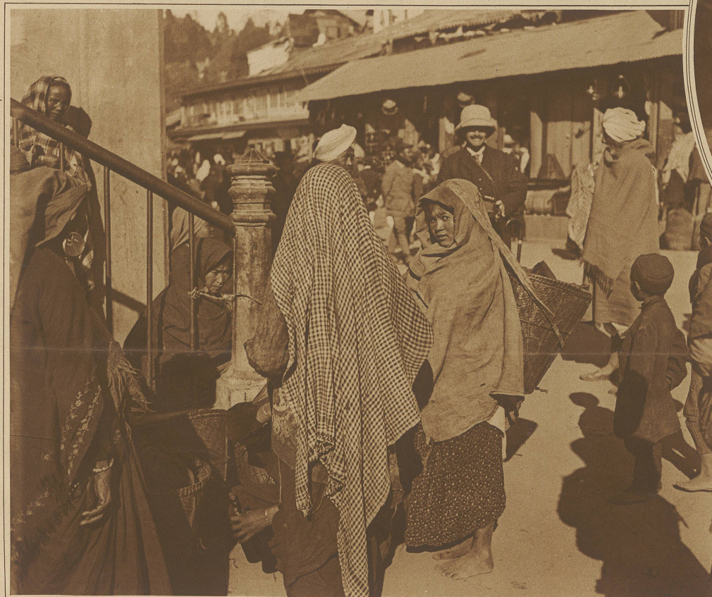
Malerischer Winkel auf dem Basar in Dardjeeling, am Fuße des Himalaja

Ein bereites Zeugnis meiner Auffassung bekam ich durch Äußerungen eines Eingeborenen der holländischen Kolonien, der rundweg erklärte: «Die Missionen schätzen wir schon, da sie uns Gelegenheit geben, manches zu lernen, was uns sonst verschlossen bliebe, aber unserer angestammten Religion werden wir dadurch nicht untreu; die christliche können wir ja vergessen, wenn wir ausgelernt haben.» Man darf auch die exotischen Völker nicht so harmlos nehmen, wie sie sich als unsere Gäste auf Völkerschauen bei europäischen Veranstaltungen zu gebärden belieben. / Diese Entwurzelten, die wohl herausbekamen, daß der beliebte «bakshish» bei solchen Vorstellungen locker in der Tasche des Zuschauers sitzt, haben außerdem ihr Bestes, die Prägung ihrer Persönlichkeit mit dem Verlassen der Heimat, dem Aufgeben der Bodenständigkeit verloren. / Welch anderes Bild bekommt man, wenn man sich im Orient als stiller Beobachter auf einen Basar begibt. Auch dort gehören Darstellungen zur Tagesordnung. Sie werden jedoch nicht von einem Unternehmer finanziert, sondern von Volkskindern den Volksgenossen zur Unterhaltung in Szene gesetzt. Köstliche Frische und