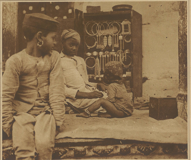
Juwelierladen in Udaipur