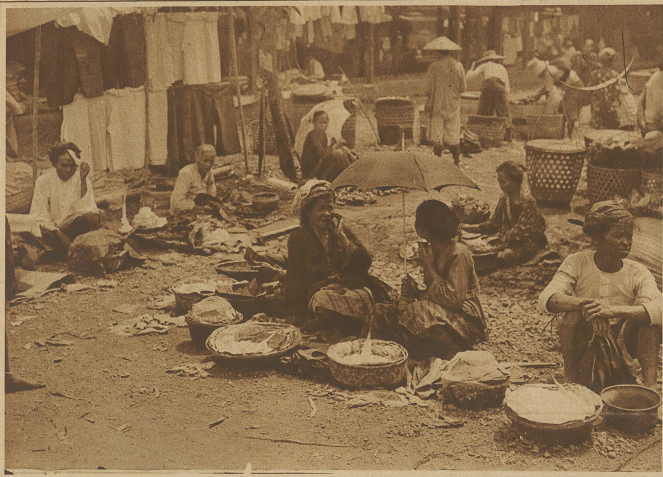
Javanische Händler haben in wildem Durcheinander ihre Waren auf der Straße zum Verkaufe ausgebreitet

gleichen Schicksal nicht entgangen, hätten wir nicht vorsichtshalber bei einem holländischen Kolonisten Erkundigungen eingezo-gen und erfahren, daß nur der aller-dings trostlos aussehende kurze Verbindungsweg zu überwältigen sei und man dann auf der Staats-straße sicher gut im Auto weiter-fahren könne. Der Holländer nahm uns mit in sein Haus, um uns auf einer Karte die Lage klar zu ma-chen. Als wir herauskamen, hatten unsere Chauffeurs den Wagen be-reits in einen Schuppen gestellt und sich gleich ihren Kollegen auf den Basar begeben.