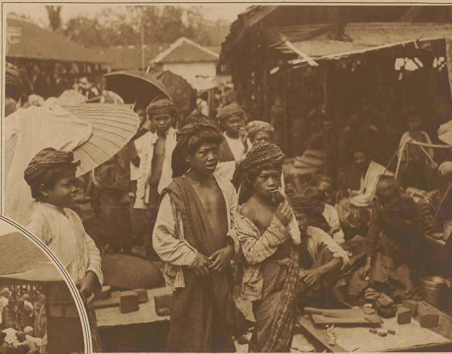
Marktleben in Garoet auf Java

Da befindet er sich mit einem Schlage im Mittelpunkt lebendigen, echten Volkstums. Nirgends sieht man den Eingeborenen sich freier bewegen, nie aufgeschlossener in der Bereitwilligkeit, dem Fremden nationale Eigenheit zu zeigen und zu erklären. Will man der Zutraulichkeit noch einen besonderen Anreiz geben, dann wählt man zur Unterhaltung nicht die Sprache des kolonialen Beherrschers, sondern die Ursprache der Landeseinwohner. / Die schauspieler oft mehr, als man schlechthin annimmt, wenn sie sich auf Fremdeneffekt einstellen oder von Europäern einen Vorteil erlangen wollen.