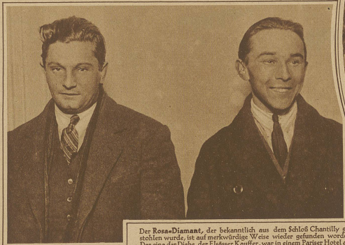
Der Rosa-Diamant, der bekanntlich aus dem Schloß Chantilly ge- stohlen wurde, ist auf merkwürdige Weise wieder gefunden worden. Der eine der Diebe, der Elsässer Kaufherr, war in einem Pariser Hotel ab- gestiegen. Ein offenbar neugieriges Zimmermädchen öffnete in Ab- wesenheit des Gastes dessen Koffer, fand darin einen Apfel und biss müßig hinein. Die Zähne krachten auf einen harten Gegenstand und bei näherem Zusehen stellte sich heraus, daß der berühmte Rosa-Diamant im Apfel verborgen war. Unser Bild zeigt den berechtigten Dieb Kaufherr und seinen Komplizen Souter