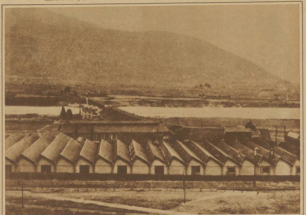
Die Chlorwerke von Saint Auban bei Digne (Frankreich) sind letzte Woche durch eine Ex- plosion von 20000 Kilo eines Chlorpräparates in die Luft geflogen. 25 Arbeiter wurden dabei getötet und 79 verletzt