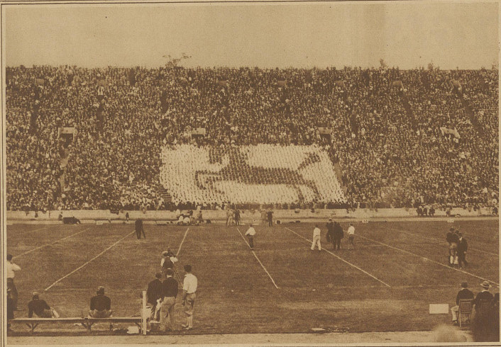
Auf eine originelle Idee sind die Studenten der Universität von Südkalifornien verfallen. Sie begleiten ihre Sportsmannschaften zu den Kämpfen gegen andere Universitäten und unterstützen sie nicht etwa nur mit dem in Amerika üblichen Kriegsruf, sondern auch durch die im Bilde ersichtliche Figur. Dieses «trojanische Pferd» (die Studenten nennen sich Trojaner) wird mittels roter Karton- scheiben erzeugt, die vor die weißen Sweaters gehalten werden. Ein geschickter Manager ist imstande, die Studenten so zu diri- gieren, daß das Pferd galoppierende Bewegungen macht