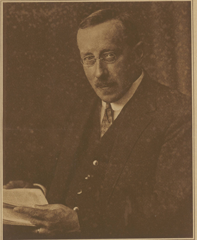
Rudolf von Tavel, unser erfolgreichster Schweizer Mund- artdichter, feierte letzte Woche seinen 60. Geburtstag