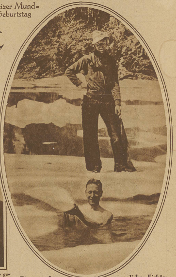
Ein mensche- licher Eisbär: Ein Farmer in Amerika, der sich auch durch Eisschollen und strengste Kälte nicht von seinem gewohnten Morgen- bad abhalten läßt