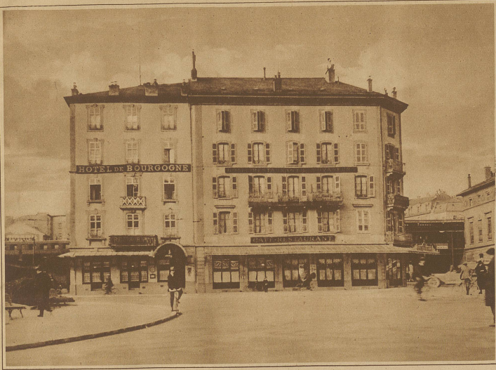
Zum Neubau des Bahnhofes in Genf. Am 13. Februar soll mit den Aus- brucharbeiten im Gebiete des neuen Genfer Bahnhofes be- gonnen werden. Neben an- dern Besichtigungen fallen den Erweiterungsarbeiten auch die im Bilde ersichtlichen Hotels «de Bourgogne» und «des Voyageurs» zum Opfer, deren Besitzer aufgebodert wurden, die Räume bis Ende Januar zu verlassen.