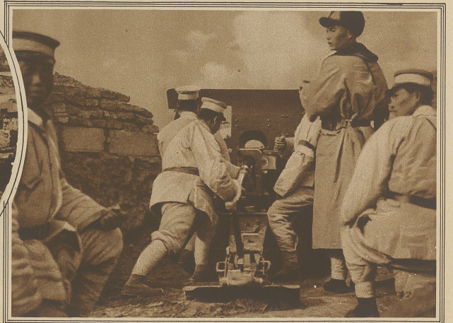
Ein chinesisches Schnellfeuergeschütz in Aktion