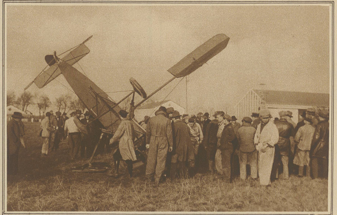
Das Schraubenflugzeug des spanischen Ingenieurs Cierva ist letzte Woche nach einigen gelungenen Versuchen, bei welchen es Höhen von 300 m erreichte, aus bisher unbekanntem Ursachen abgestürzt. Der Pilot kam mit leichten Verletzungen davon