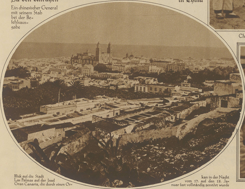
Blick auf die Stadt Las Palmas auf der Insel Gran Canaria, die durch einen Or-