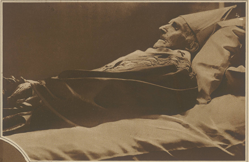
Mit Kardinal Mercier, der am Nachmittag des 23. Januar in Brüssel gestorben ist, sinkt wohl die bekannteste Persönlichkeit Belgiens ins Grab. Unser Bild zeigt Kardinal Mercier auf dem Totenbett