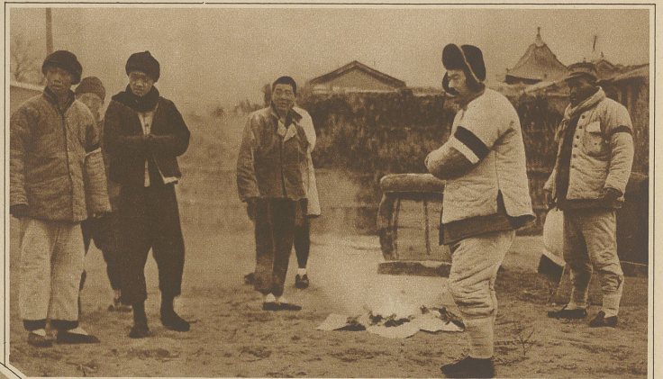
Chinesische Offiziere entzünden das Heilige Feuer vor dem Sarge eines toten Kameraden