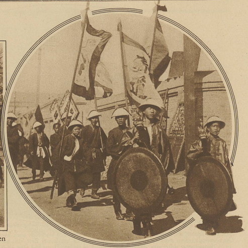
Aus dem Begräbnis eines chinesischen Generals