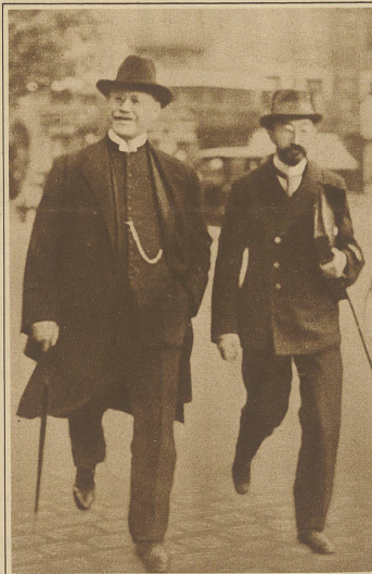
Ein dänischer Bischof wegen Geldbetrügereien angeklagt. Vor dem Landesgericht in Kopenhagen findet diesem Monat der Prozess gegen Anton Rest, den Bischof der methodistischen Gemeinde, statt, der ihm anvertraute Gelder statt zur Unterstützung armer Leute für seine eigenen Bedürfnisse verwendete. Ebenso gingen große Summen durch mangelhafte Buchführung verloren. Bischof Anton Rest (links) mit seinem Verteidiger