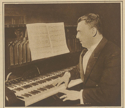
Letzte Woche fand in Berlin das erste Konzert mit dem Vierteltonklavier statt. Unser Ohr wird dieser neuesten Erfindung wohl nur zögernd zu folgen vermögen. Das Bild zeigt den Komponisten Schulhoff am neuen Instrument