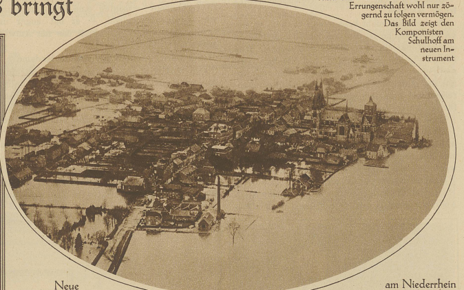
Neue Ueberschwemmungen am Niederrhein und an der Maas Flugzeugaufnahme des holländischen Städtchens Cuyk, das vom Hochwasser der Maas völlig eingeschlossen ist