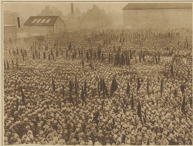
Über 100000 Reichsbanner-Leute aus allen Gauen Deutschlands trafen sich letzten Sonntag zur zweiten Bundesgründungsfeier. Unser Bild zeigt einen Blick auf die Versammlung mit den unzähligen Fahnen auf dem Sportplatz vor dem Lübecker Tor