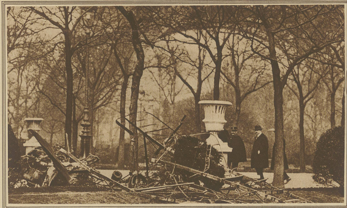
Auf Grund eines Vertrages mit einem Filmunternehmen versuchte am Mittwoch der französische Militärflieger Collet unter dem Bogen des Eiffelturmes hindurchzufliegen. Das Waggestück gelang ihm auch, doch fiel der Apparat beim Wiederaufrichten gegen eine Antenne des Radioturmes auf dem Marsfeld und stürzte ab. Der Flieger wurde als verbrannte Leiche unter den Trümmern hervorgezogen. Unser Bild zeigt den zerschmetterten Apparat und im Hintergrund den Bogen des Eiffelturmes