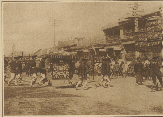
Eine bürgerliche Hochzeit, die immer noch mit altem Pomp und zeremoniellen Bräuchen gefeiert wird