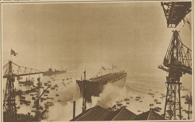
Der Stapellauf des größten italienischen Ueberschiffes "Roma". Am 26. Februar lief in Sestri Ponente bei Genua das größte italienische Ueberschiff von Stapel. Der Dampfer ist 213 Meter lang, hat 23 000 Tonnen Wasserverdrängung und eine Geschwindigkeit von 23 englischen Meilen