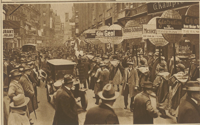
Zur Eröffnung der Leipziger Messe. Leben und Treiben in der Petersstraße am Eröffnungstage