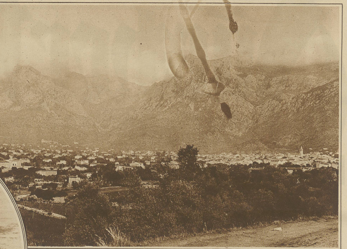
Blick auf das langgestreckte Städtchen Soller an der Nordwestküste der Insel, berühmt ob seiner Orangenausfuhr. Die Orangen von Soller gelten, obwohl sie sehr klein sind, als die besten der Welt. Unmittelbar hinter dem Städtchen erhebt sich der Buig Mayor (1445 m) der höchste Gipfel der Insel

Aber ein Hauch der modernen Zeit ist trotzdem auch nach Mallorca gedrungen. Schon die Sand hatte unrecht, als sie schrieb, daß auf der Insel «jegliche Industrie mangle»; denn die Töpferei wurde auf Mallorca seit alters gepflegt und ihre Erzeugnisse genossen solchen Ruf, daß das Wort «Majolika» — eine Verballhornung des Wortes Mallorca — geradezu zur Bezeichnung der Gattung der kunstvoll überglasierten Töpfereien wurde. Heute aber qualmen in Palma, der Hauptstadt, und in einigen anderen Orten der Insel die Fabrikschornsteine wie anderswo, wenn auch in beschränkter