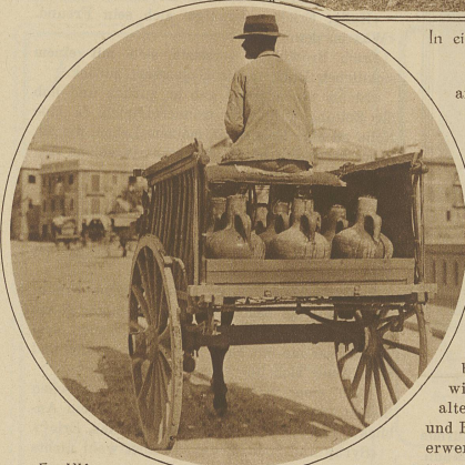
Ein Wasserverkäufer auf der täglichen Rundfahrt zu seinen Kunden

Landhaus, das er sich inmitten seines Besitzes errichtet hatte, gab er den Namen Miramar , und hier verbrachte er sein Leben lang inmitten seiner Bücher und seiner Sammlungen, wenn er nicht irgendwo im Innern nach Steinen grub oder nach alten Volkssagen forschte. Ob Mallorca jemals ein Reiseziel größeren Stiles und damit — wie es so schön heißt — «dem Fremden-er erschlossen» werden wird, muß, solange das Dampfboot nicht gänzlich vom Flugzeug verdrängt wird, bezweifelt werden. Wer die Insel in ihren stillen Schönheiten und die Bevölkerung in ihrer kindlichen Anpruchslosigkeit kennen gelernt hat, möchte fast wünschen, daß dem paradiesischen Eiland diese Fortentwicklung erspart bliebe.