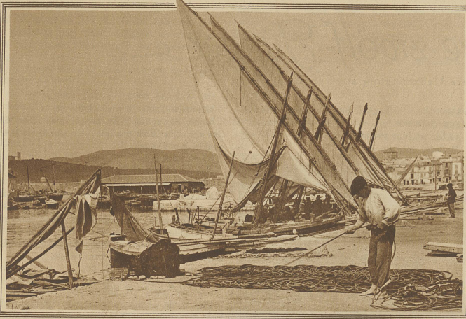
Stimmungsbild am Hafen von Palma. Fischer beim Prüfen seines Tauwerkes; dahinter zum Trocknen aufgespannte Segel. Links im Hintergrund das alte Königsschloß Bellver