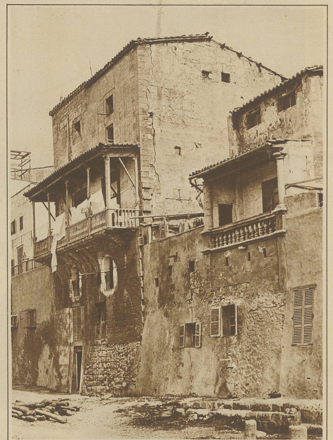
Blick auf die alte, gegen das Meer zu gelegene Stadtmauer von Palma. In die Mauer wurden, wie im Bilde ersichtlich, Wohnungen eingebaut