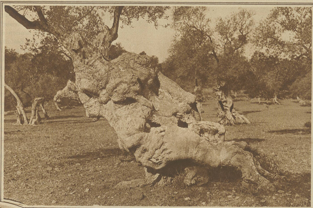
In einer Oelbaumpflanzung im Bergland der Insel mit grotesk geformten Stämmen, deren Alter auf 1000 und mehr Jahre geschätzt wird

liches Gebirge, das sich in seinen höchsten Punkten bis zu 1500 m erhebt und nur noch dem Oelbaum ein Fortkommen gestattet, reich an Abwechslung und an malerischen Ausblicken, — dort (und dies ist weitaus der größere Teil) eine endlos scheinende Ebene, über die zwar die Natur ihr ganzes Füllhorn ausgegossen hat, die aber aller landschaftlichen Reize barm ist, sofern nicht kunstgerecht angelegte Pflanzungen von Orangen, Zitronen, Feigen, Mandeln und anderen Südfrüchten als reizvoll