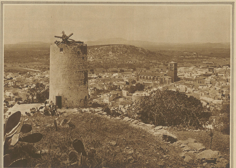
Blick auf das Städtchen Felanitx im Flachland der Insel, nahe der Ostküste gelegen und berühmt ob seiner kunstvollen Töpfererei, die schon im Altertum großen Ruf genossen. Im Vordergrund eine verfallene Windmühle