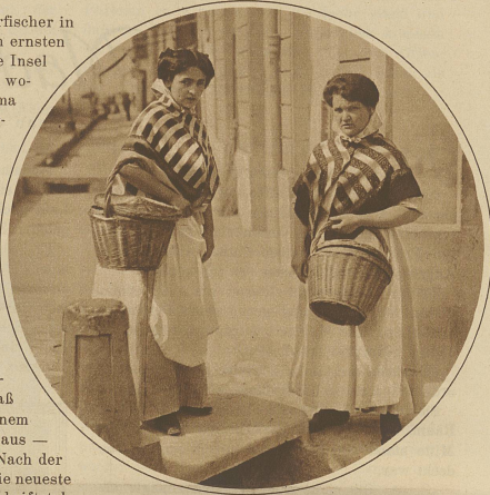
Landestübliche Tracht der Einwohnerinnen von Palma: großgemustertes Schal mit dem «Reboillo», einem unter dem Kinn geschlossenen, meist auf den Nacken herabfallenden Keptuch aus weissem Tüll

Lust hat — das Leben der Mittelmeerfischer in all seinen Erscheinungsformen — den ersten und den heiteren — studieren. / Die Insel zählt heute rund 333000 Einwohner, wovon etwa 70000 auf die Hauptstadt Palma entfallen. Ihre Sprache ist das «Mallorquinische», eine dem Katalonischen verwandte Mundart, aber reichlich mit arabischen Bestandteilen durchsetzt. Die Insel umfaßt 3648 qkm, ist also etwas mehr als doppelt so groß wie der Kanton Zürich. Trotz der Entwicklung des modernen Verkehrs ist die Insel kein Touristenziel im weiteren Sinne geworden, wie sie ob ihrer Eigenart sicher verdiente. Abseits der üblichen Seeverkehrswege gelegen, ist Mallorca für den Durchschnittsreisenden un bequem zu erreichen, und so kommt es, daß in der Hauptsache Franzosen — dank einem direkten Schiffverkehr von Marseille aus — zu den Besuchern der Insel zählen. Nach der Sand haben sich in Frankreich, bis in die neueste Zeit hinein, eine ganze Reihe von Schriftstel-