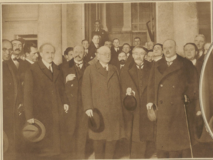
Scialoja (Italien), Vandervelde (Belgien), Luther (Deutschland), Briand (Frankreich) und Stresemann (Deutschland) nach der ersten Besprechung in Genf

Unteres Bild: Die Fahnen der Völkerbundsmitglieder