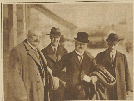
Die schweizerische Delegation. Von links nach rechts: Ständerat Bolli, Bundesrat Motta und Nationalrat Gaudard