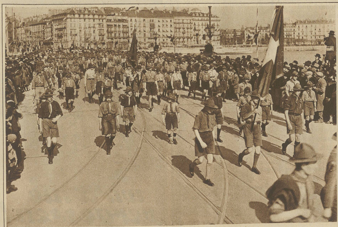
Die Pfadfinder aus den drei Kantonen Bern, Freiburg und Genf