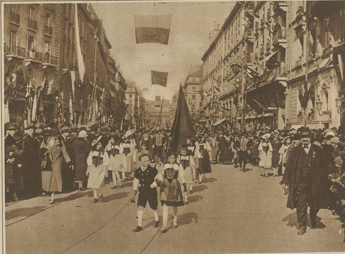
Der Festzug in der reich beflaggten Rue du Mt. Blanc