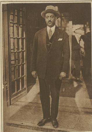
Eine Sensation im Genfer Stadtbild: Makonnen, der erste Delegierte Aethiopiens