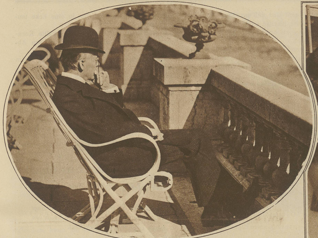
Der britische Außenminister Chamberlain in resignierter Stimmung auf der Terrasse seines Hotels