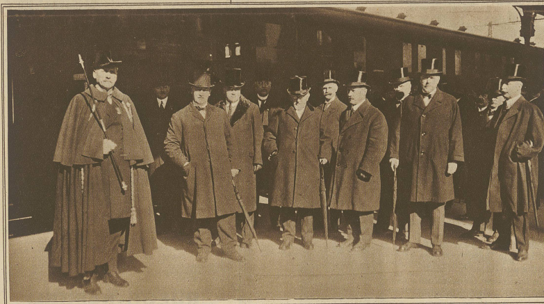
Ankunft der Regierungsvertreter von Bern und Genf im Bahnhof Cornavin

400. Jahresfeier der Gemeinbürgerschaft zwischen Bern, Freiburg und Genf