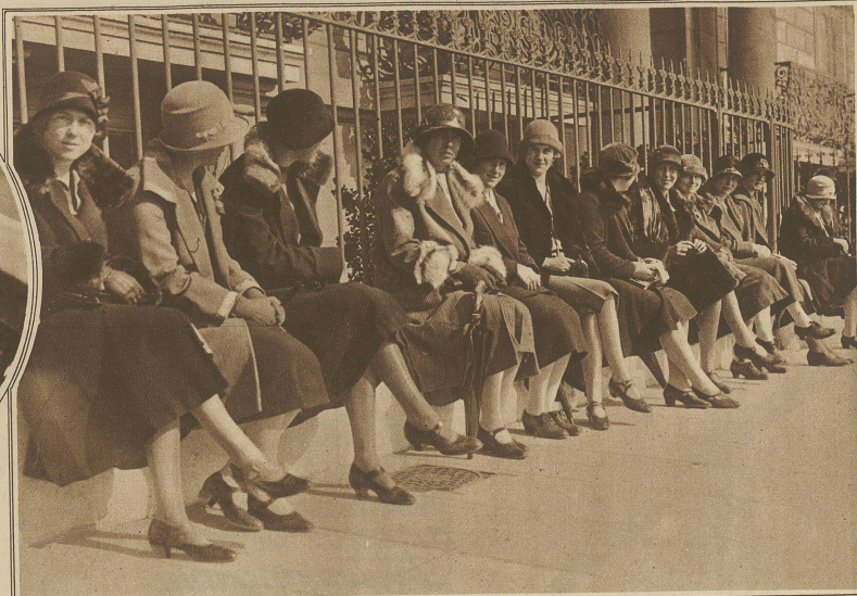
Die Genfer Damenwelt wartet stundenlang auf ihren Liebbling Chamberlain