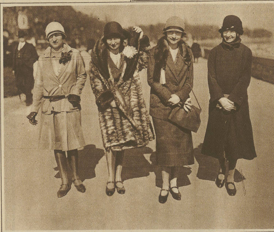
Nachlese der Genfer Völkerbundsversammlung