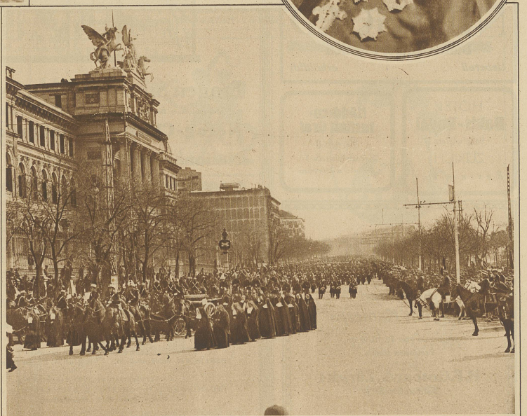
Blick auf den imposanten Trouerzug zu Ehren des in Madrid verstorbenen Kardinals Benlloch