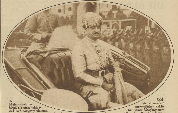
Der Maharajah, im Schmucke seines goldbestückten Staatsgewandes und mit den größten Diamanten und anderen