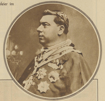
Bild rechts Kardinal Benlloch, Erzbischof von Burgos, ist in Madrid gestorben