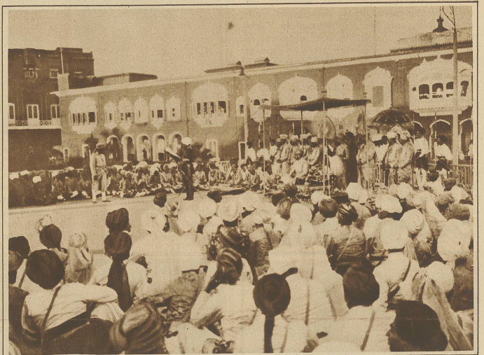
Bild aus dem Zeremoniell der Krönungsfeier im großen Hofe des Königspalastes