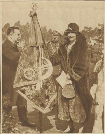
Die spanische Königin empfängt aus den Händen des Alcaide von Malaga das Banner der von der Marokkofront zurückgekehrten spanischen Regulares