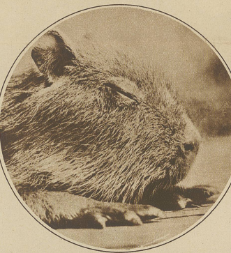
Kopf eines Capibaras

doch bedeutend länger behaart ist. Ein Affe dieser Sorte ist meines Wissens in einen zoologischen Garten Englands verbracht worden. Vielleicht kann er dort ein bequemes und gemüthliches Leben führen. Alle diese Affen sehen wild aus, sind aber leicht zu zähmen und werden sehr anhänglich.