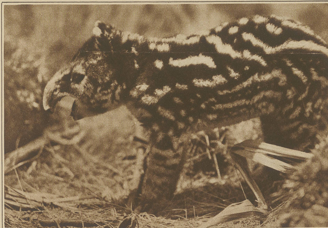
Junge Bergwasserschweine (Tapir). Diese Tiere leben in den höheren Regionen der Amazonen und lassen sich in den warmen Dschungeln selten sehen