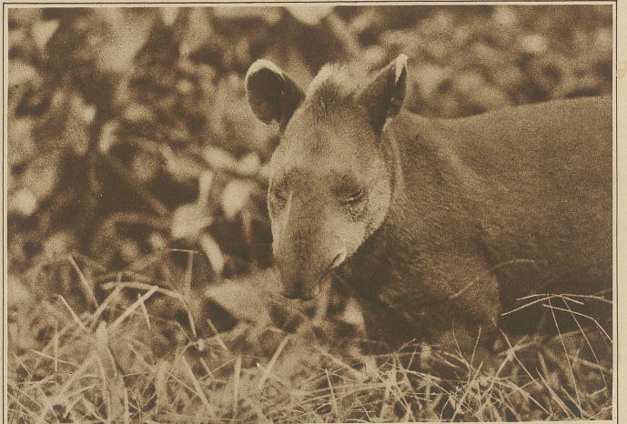
Der gewöhnliche Tapir. Dieser Tapir besitzt im Gegensatz zu seinem Bergvetter ein viel dünneres Fell. Seine Spuren sind meistens den Flußufern entlang zu finden

In einzelnen Waldgegenden stießen wir auf Spuren der Jaguars und anderer Katzensorten.