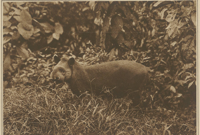
Tapir aus den Dschungeln