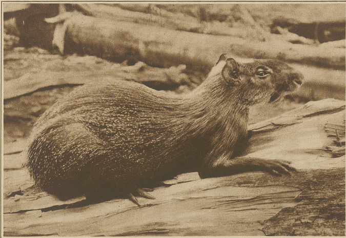
Der Huatusa oder Aguti. Ein Nager in der Größe eines Hasens

Eines Tages, als wir in Canoes stromabwärts fuhren, entdeckten wir auf Sandbänken Ca-