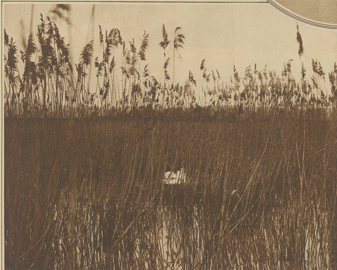
Der brütende Rapperswiler Schwan im Frauenwinkel