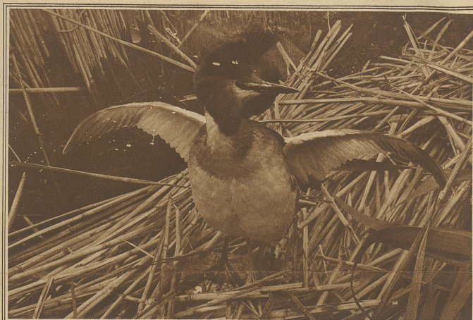
Haubentaucher (Männchen) im Hochzeitskleide