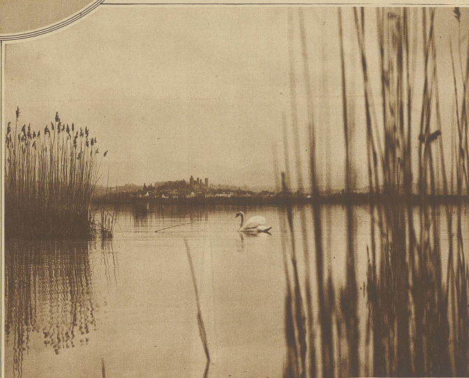
Der Frauenwinkel gegen Rapperswil