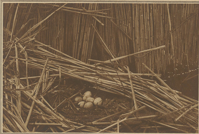
Nest mit Gelege des Haubentauchers