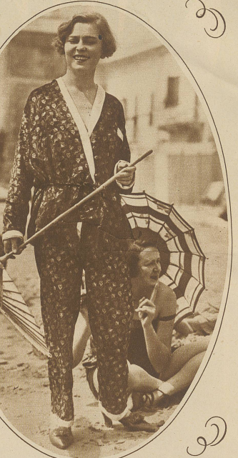
An sonnigen Gestaden Eine Bade-Schönheit in ihrem aparten Strand-Pyjama

Trotz! Manila, Roßhaar und Florentiner-Stroh sind bevorzugt. Der neue Hut ist hinten flach, an den Seiten aber weit ausladend, mit breiter Vorderkrempe, die das Gesichtchen der Schönen geheimnisvoll beschattet und die Augen noch verführerischer darunter hervorblicken läßt. Farbiger oder schwarzer Samt weich um den ziemlich hohen Kopf geschlungen, die Krempe von dem gleichen Material umrandet, hier und da versuchsweise ein Blumentuff, ergibt geschmackvolle Modelle. Können wir aber den kleinen Hut nun entbehren? Keineswegs! Von dem Begriff des ausrasierten Nackens wird das knappe, schmalrandige Hütchen, sei es aus Filz, sei es aus der so modernen sommerlichen Häckelarbeit hergestellt, nicht mehr zu trennen sein. Keck und fesch auf den rassistigen Kopf gedrückt, ist und bleibt es der Liebling der Damen nach wie vor. Der große Hut ist der Nachmittag- und Abendtoilette reserviert. Der kleine Hut dem Shopping am Vormittag, der Morgenpromenade, dem Trotteur oder Mantel. / Ach, den Mantel hat uns der regenspendende Himmel in diesem Sommer so recht zum Freunde