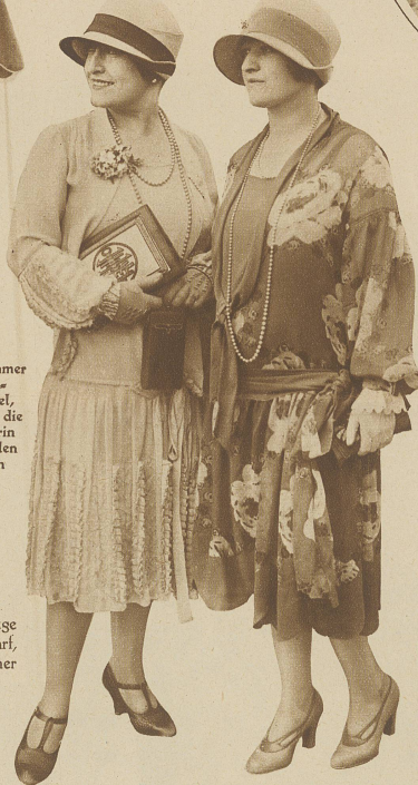
Das elegante, großblumige Chiffon-Kleid

gemacht! Es wird nötig sein, daß die Mode für solche Wetterabnormitäten neue, originelle Einfälle bereit hält. Denn wir wollen und sollen auch unter drückendster Wolkenlast chic und geschmackvoll sein, was sich mit Zweckmäßigkeit sehr wohl vereinen läßt. Die heliotrop- und lavendellarbigen imprägnierten Regenmäntel sind ein willkommener Schritt vorwärts in dieser Richtung. Vielleicht gelingt es ihnen, dem Himmel ein Lächeln abzurufen über diesen kindlichen Versuch, des Sommers Farben bei Sturm und Regen spazieren zu führen.