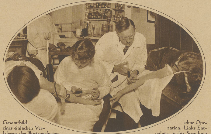
Gesamtbild eines einfachen Verfahrens der Bluttransfusion