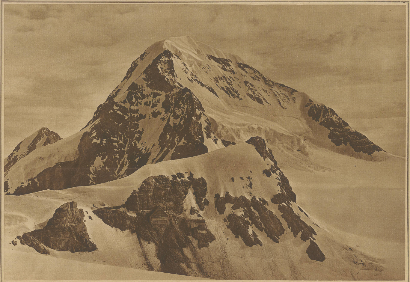
DAS BERGHAUS JUNGFRAUJOCH MIT SPHINX UND MÖNCH