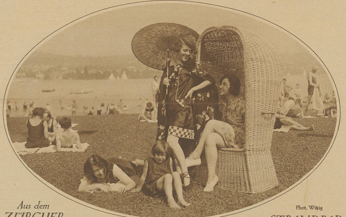
Aus dem ZÜRCHER

Und der alte König? Von ihm schweigt die Geschichte. Die Historiker haben vergessen, uns zu berichten, ob er noch ein Wort hinzugefügt oder ob er geschwiegen. Wahrscheinlich hat er es verzogen, zu schweigen. Vielleicht war er ja gläubig! Vielleicht aber schämte er sich auch, daß er so alt hatte werden müssen, um zu der Erkenntnis zu gelangen, daß man gegen eine Frau niemals ankommt, selbst wenn man den lieben Gott um seine Wunder zu Hilfe ruft.