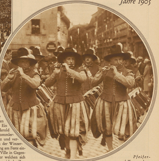
Reminiszenzen an das letzte Winzerfest im Jahre 1905

In Vevey hat am Sonntag, dem 29. Mai, der erste Auftakt zum diesjährigen Winzerfest stattgefunden mit der offiziellen «Publication» des Festes. Diese von der alten, streng eingehaltenen Tradition vorgeschriebene Ankündigung des Festes muß zwei oder drei Monate vor der eigentlichen Abhaltung erfolgen und zwar unter genau vorgeschriebenen Zeremonien. Ein in der Ratsstrach des 18. Jahrhunderts gekleideter Herold durchschreitet unter Vorantritt einer Pfeifer- und Trommlergruppe die Straßen der Stadt bis nach La Tour-de-Peilz und verliest an bestimmten Stellen die vom Abbé-Präsidenten der Winzerbruderschaft verfaßte Proklamation, die zur Beteiligung am Feste einladet. Die erste Verlesung erfolgt vor dem Hotel de Ville in Gegenwart der städtischen Behörden und Ehrengäste, unter welchen sich diesmal auch Bundesrat Chuard befand. Darauf bewegt sich der Zug unter den abwechselnden Klängen eines Musik- und eines Pfeiferkorps durch die dichtbesetzten Straßen, wobei die Bevölkerung auch Gelegenheit hat, einzelne probeweise zusammengestellte Kostümgruppen aus dem Winzerfeste kennen zu lernen. Der 29. Mai hatte bereits eine große Menschenmenge nach Vevey gelockt, wo die im Rohbau vollendete riesige Festarena einen Begriff vermittelt von dem geplanten Umfang des diesjährigen Winzerfestes. Sie enthält Sitzplätze für mehr als 13,000 Zuschauer.