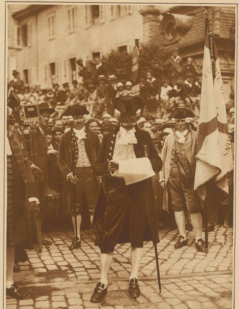
Das Verlesen der Proklamation in den Straßen von Vevey durch den Herold