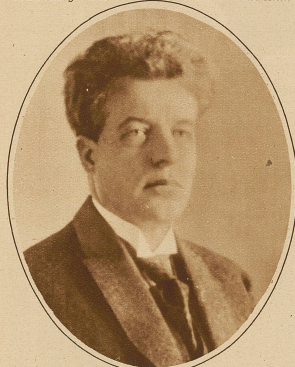
Wojkow, der russische Gesandte in Polen, ist in Warschau durch einen russischen Studenten ermordet worden. Wojkow genoss lange Jahre das Asylrecht der Schweiz und verließ Genf erst im Jahre 1917. Er galt als der eigentliche Urheber der Ermordung der Zarenfamilie.