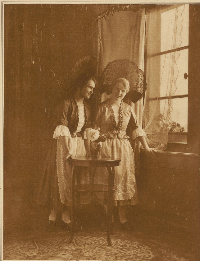
Die neugeschaffene Rapperswiler Tracht

Flo drückt auf die Stirne von Signorina wie allabendlich einen Gutenachtkuß, in diesen Kuß ihre ganze Liebe für die angebetete Lehrerin, die ganze Zärtlichkeit, deren ihre reine Natur fähig ist, legend.