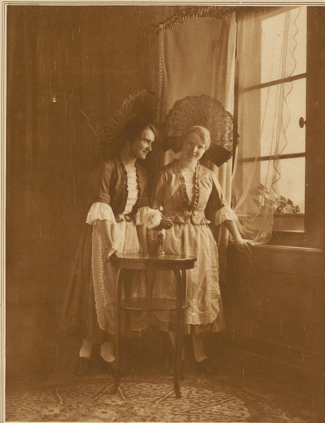
Die neugeschaffene Rapperswiler Tracht

Flo drückt auf die Stirne von Signorina wie allabendlich einen Gutenachtkuß, in diesen Kuß ihre ganze Liebe für die angebetete Lehrerin, die ganze Zärtlichkeit, deren ihre reine Natur fähig ist, legend.