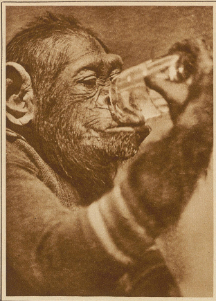
Fips hat Durst

«Sie werden sehen, Signorina, daß ich morgen meine Lektion viel besser können werde!» flüsterte sie. Ich will noch heute bis zum Einschlafen mir vorsagen: Ich liebe den Sohn des Bäckers, der Bruder des Schornsteinfegers liebt mich!»