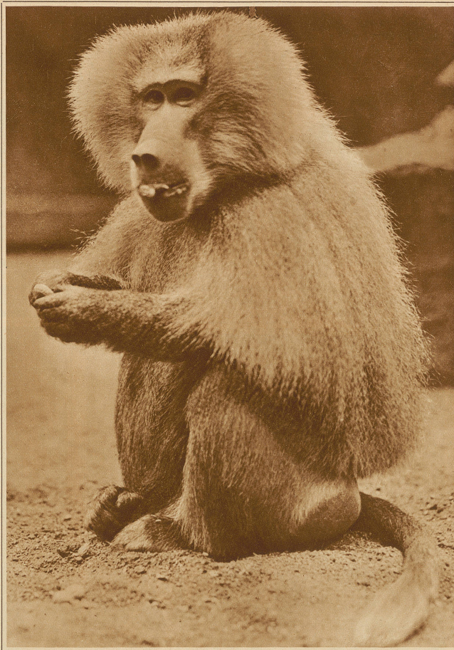
Mantelpavian aus Abessinien

«Das Bad wartet schon,» sagte sie freundlich. «Du mußt dich aber noch einen kleinen Augenblick gedulden,» ruft Flo plötzlich aus und sie schüttelt ärgerlich den Kopf. Jetzt habe ich erst meine Grammatik im Studierzimmer