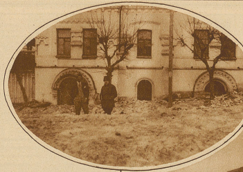
Die Rundbogen-Eingänge zum Keller, in welchem die Zarenfamilie erschossen wurde

Bisher mußte bei längeren Fahrten eines Luftschiffes, wenn der mitgeführte Vorrat an flüssigen Brennstoffes allmählich geringer wurde, die dadurch hervorgerufene Verminderung des Luftschiffgewichtes durch Ablassen einer entsprechenden Menge von Wasserstofftraggas ausgeglichen werden, um nicht durch zu starkes dy-