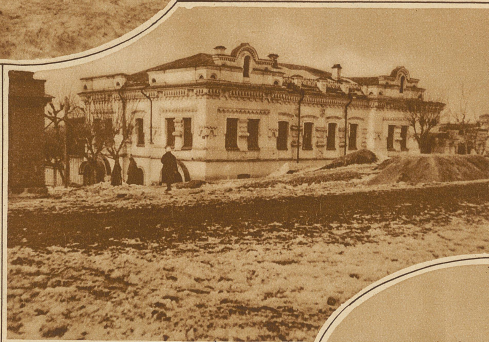
Das Schloß, der Veránungsort der Zarenfamilie