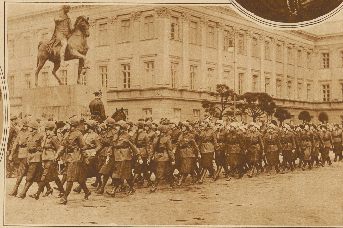
Kriegerische Jugend in Polen. Dieser Tage fand in Warschau eine Parade der Schülerinnen statt, die sich für den militärischen Hilfsdienst hinter der Front im Kriegsfall vorbereiten