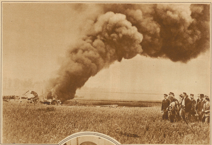
nach 10 km fing der Motor Feuer; die rasch vorgenommene Notlandung glückte und die Flieger konnten fliehen, bevor die 5000 Liter Benzin explodierten. Das Bild zeigt die Trümmer nach erfolgter Explosion