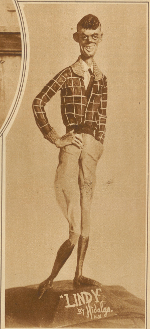
Eine groteske Wachsfigur vom Ozeanflieger Lindbergh