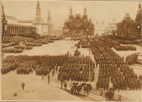
Heerschau der Roten Armee. Truppenparade auf dem Roten Platz in Moskau