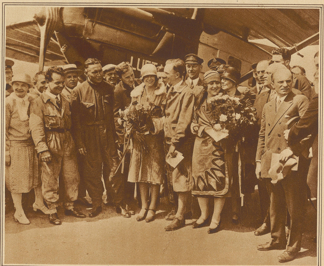
Chamberlin und Levine, die beiden kühnen Ozeanflieger, reisten nach Bremen, um ihre zu Schiff angekommenen Frauen in Empfang zu nehmen. Levine hatte seiner Frau bekanntlich die Absicht, sich am Fluge zu beteiligen, verheimlicht, so daß sie erst durch die Zeitungen von seiner „Flucht“ erfuhr. Das Wiedersehen soll aber deshalb nicht minder herzlich gewesen sein