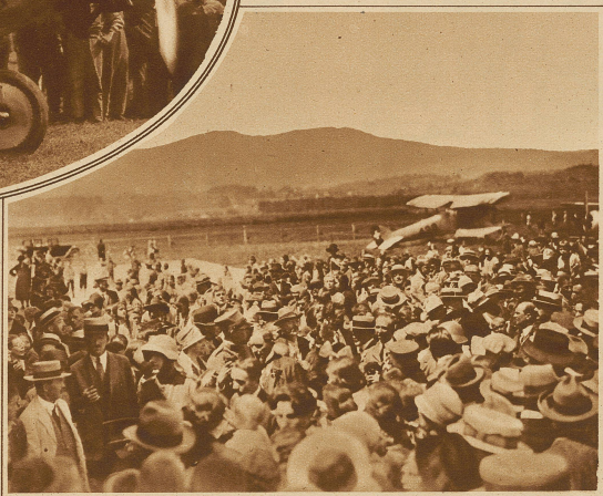
Der Empfang der Ozeanflieger in Thun