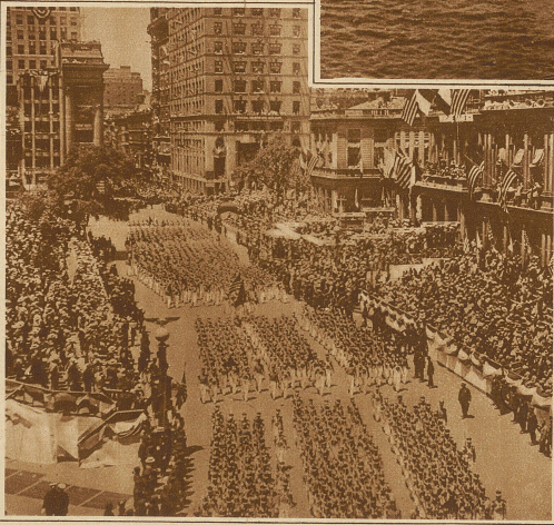
Ein New-Yorker Regiment defilirt in der neuen Paradeuniform vor Lindbergh