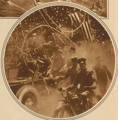
Straßenszene aus dem enthusiastischen Empfang des Fliegers