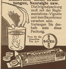
Preis für die Glasröhre Fr. 2.—

sollen vor dem Einnehmen in einem Glas Wasser aufgelöst werden, denn so wirken sie stärker und rascher, eine Wohltat für alle, die von Schmerzen geplagt werden. Unüber- troffen ist ihre Wirkung bei Kopf- und Zahnschmerzen, Rheumatismus, Glieder- schmerzen, Gicht, Erkäl- tungen, Neuralgie usw. Die Originalpackung muß mit der Regle- mentations-Vignette und dem Bayerkreuz versehen sein. Verlangen Sie des- halb stets diese Packung.