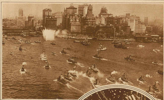
Bild rechts: Die Einholung des Ozeanfliegers im Hafen von New York Aufnahme vom Presseflugzeug aus