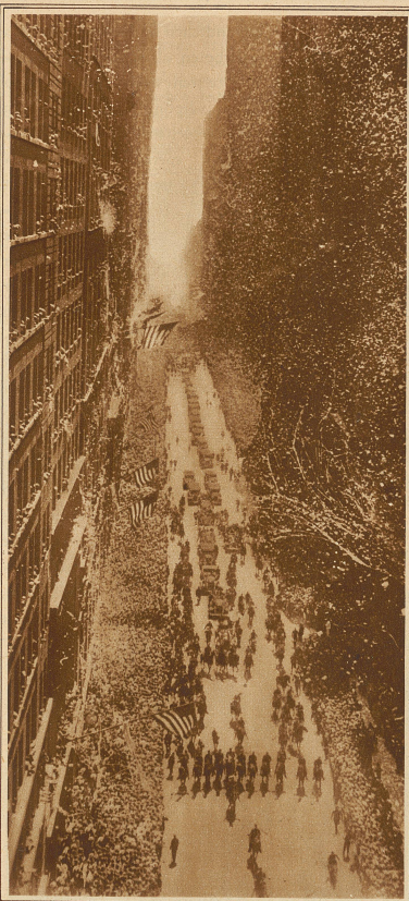
Bild links: Der Konfettiregen im New-Yorker Broadway während des Einzuges Lindberghs