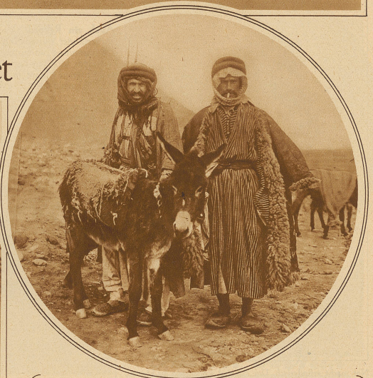
Drusen-Typen aus dem Gebiet von Damaskus