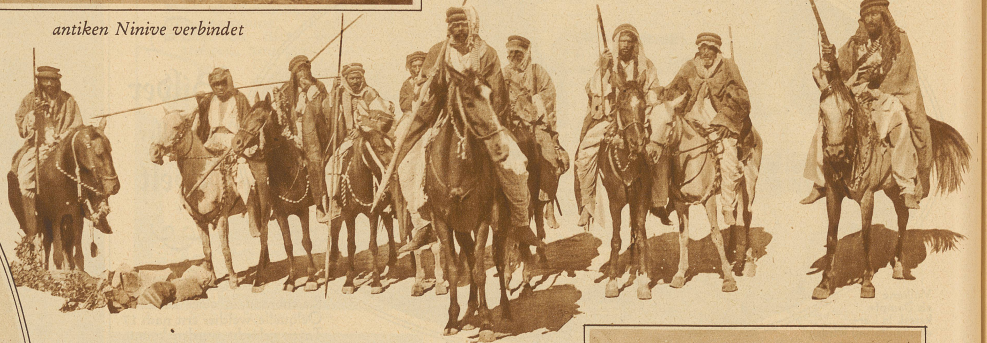
Bewaffnete Drusen im Innern Syriens