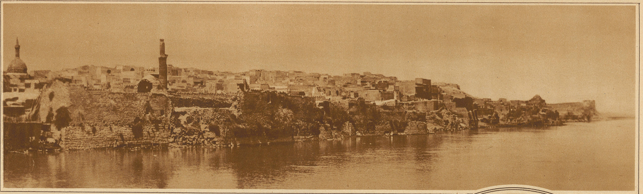
Mossul, die Araberstadt am Tigris