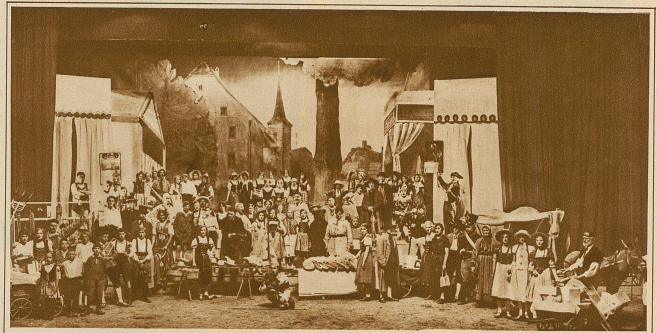
Marktszene aus dem Festspiel des aargauischen Kantonalgesangfestes in Reinach