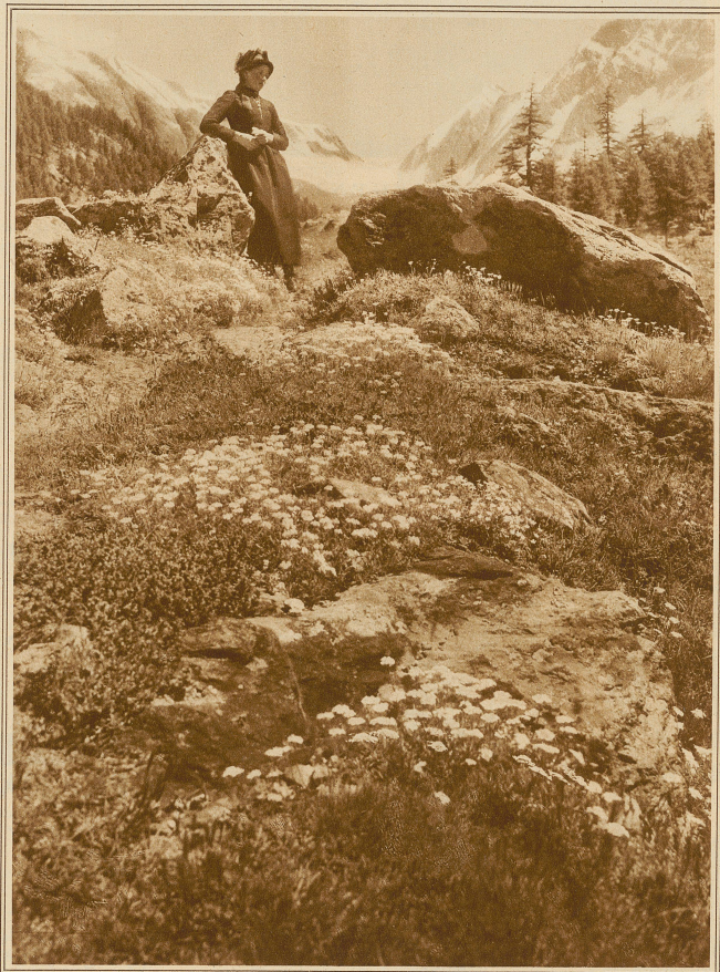
Sonntag im Löbsfenthal

Daß er das Licht entsetzlich nannte, war ebenso begrifflich wie seine Verwunderung über die Herkunft des grellen Scheins. Er schien aus den Wänden zu quellen, oder drang von oben durch die scheinbar so massiven Platten, aus denen sich die Decke zusammensetzte. Vielleicht auch gelangte er aus dem Boden empor in diesen grauenhaften Käfig. Jedenfalls gab er, wie Knut feststellte, keinerlei Schatten, war überall und drückte den Gesichtern eine gewisse Ausdruckslosigkeit auf, indem er die Umrisse