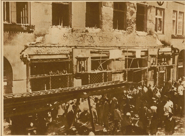
Die demolierte Redaktion der »Reichspost«