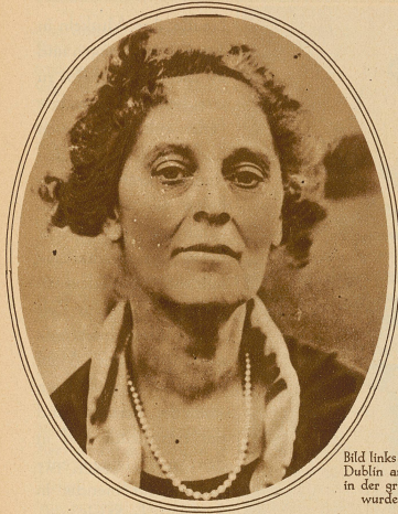
Bild links: Gräfin Markiewicz, eine Führerin der irischen Revolutionäre, ist in Dublin an den Folgen einer Operation gestorben. Die Gräfin, die stets Kleider in der grünen Farbe Irlands trug und daher allgemein »grüne Gräfin« genannt wurde, war die erste Frau, die in das britische Unterhaus gewählt wurde