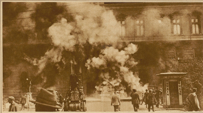
Das erste Feuerwehrauto vor dem brennenden Justizpalast