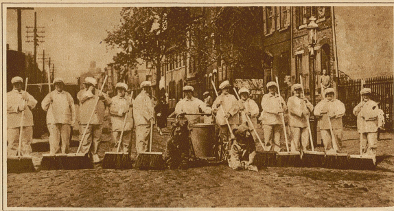
Der Frauenklub von Philadelphia will durch öffentliche Umzüge die Hausfrauen dazu erziehen, wöchentlich selber die große »Putzete« durchzuführen