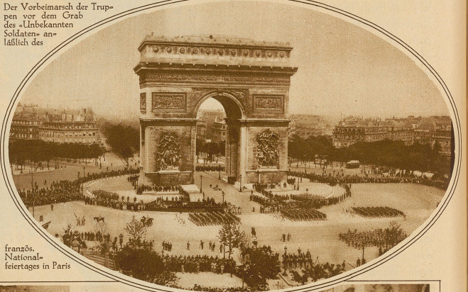
französischer Nationalfeiertages in Paris