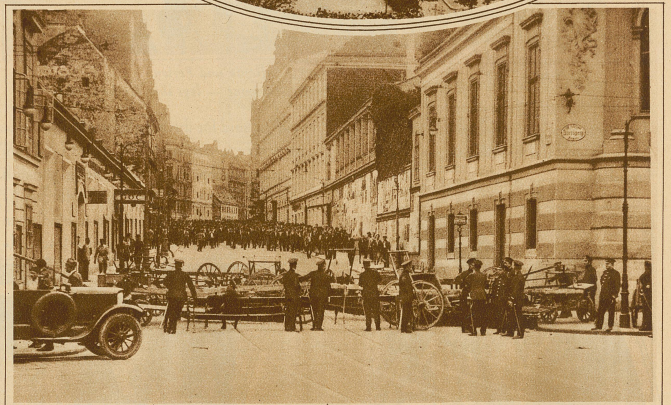
Die Barrikade in der Lerchenfelderstraße. Das Bild wurde Freitagabend 5 Uhr aufgenommen