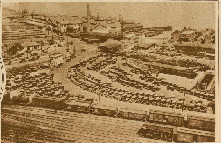
Blick auf den großen Automobil-Parkplatz von Weehawken, wo die auswärtigen Geschäftsleute von New York jeden Morgen ihr Auto zurücklassen, um sich durch eine Fähre zur Stadt übersetzen zu lassen