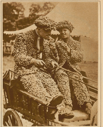
Bild rechts: Die Erdnuß-Könige. Bei einem Fest der Londoner Straßenhändler wurde das originellste Kostüm zweier Erdnußhändler, das aus lauter Erdnüssen bestand, preisgekrönt