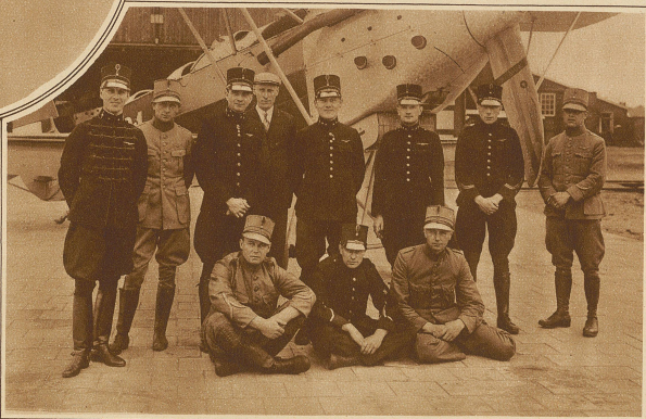
Die holländische Equipe für das Zürcher Flugmeeting